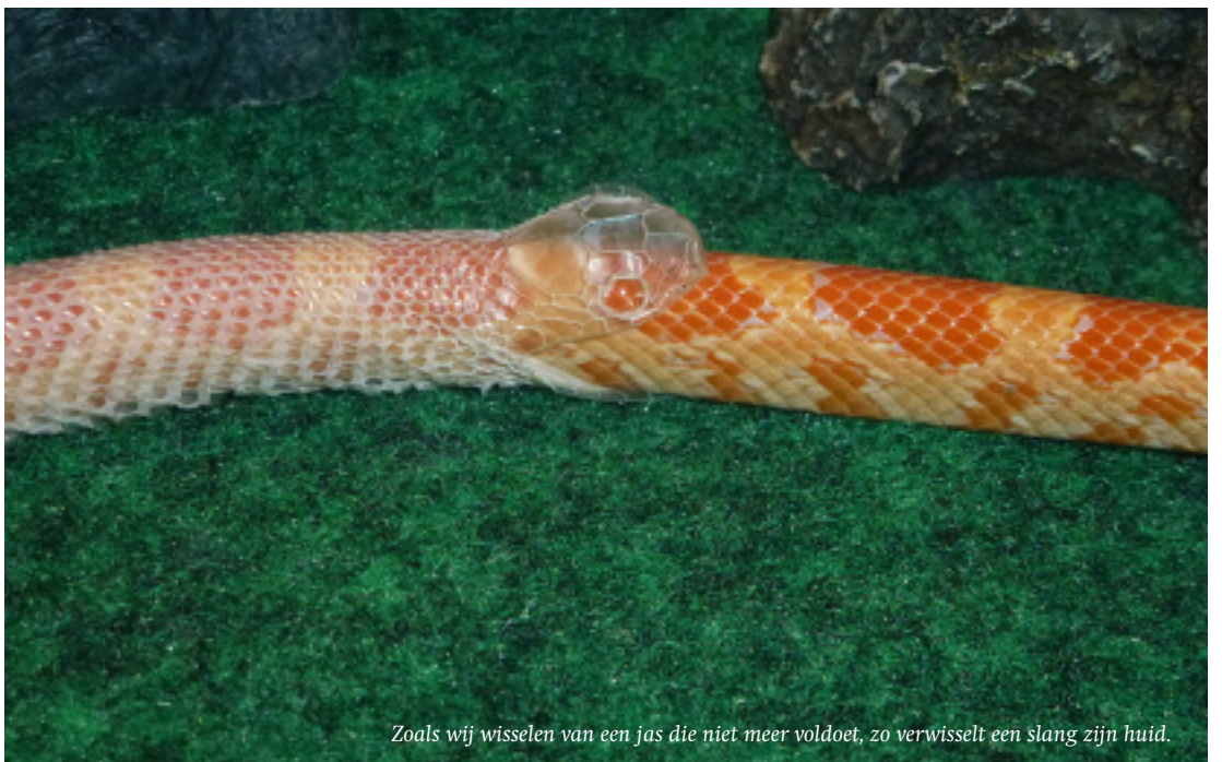
Zoals wij wisselen van een jas die niet meer voldoet, zo verwisselt een slang zijn huid.

Voor deze transformatie is veel energie en Geest-kracht nodig!