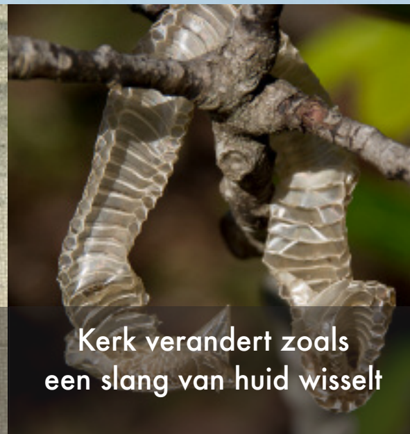
Kerk verandert zoals een slang van huid wisselt