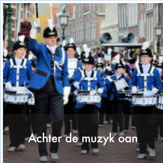
Achter de muzyk oan