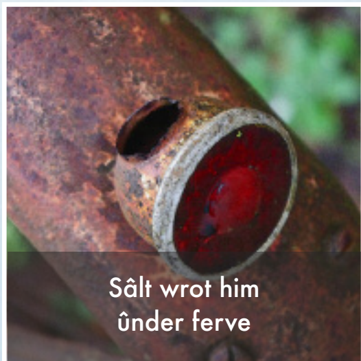
Sâlt wrot him ûnder ferve