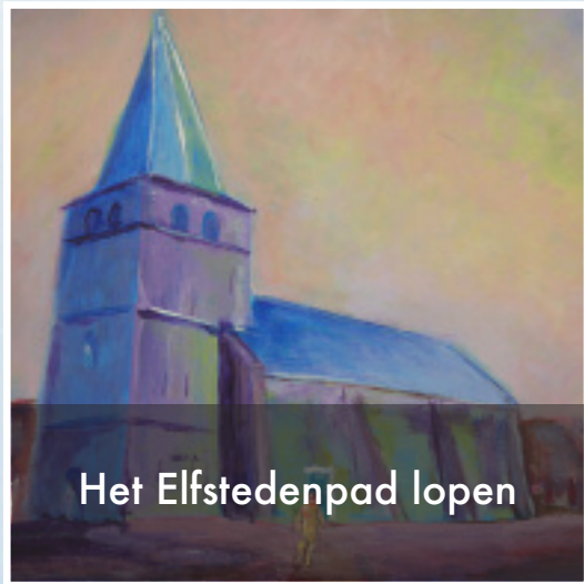
Het Elfstedenpad lopen

Het is heilzaam om te beseffen hoe ergerniswekkend het kruis van Christus is