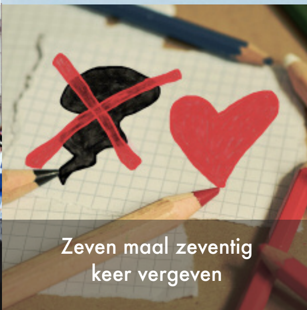
Zeven maal zeventig keer vergeven