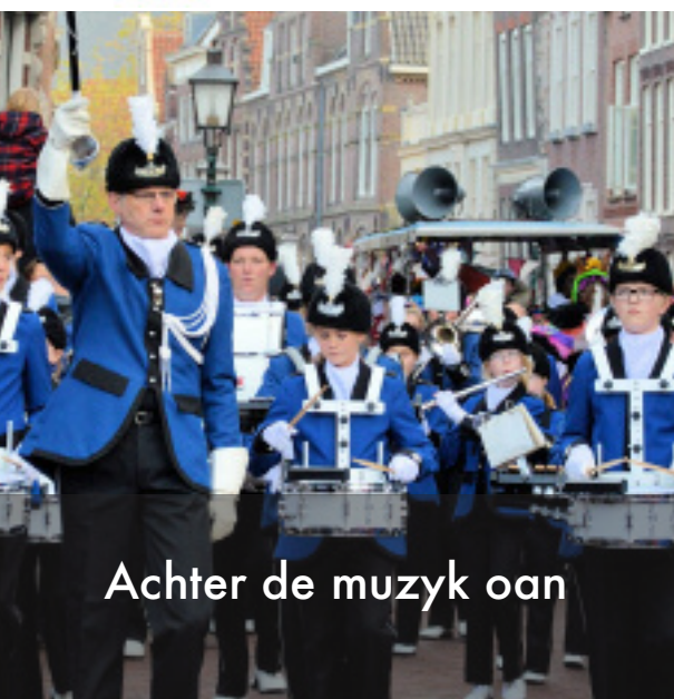
Achter de muzyk oan