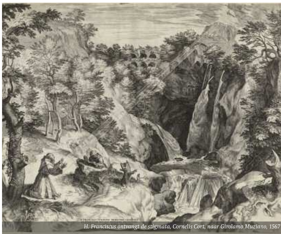
H. Franciscus ontvangt de stigmata, Cornelis Cort, naar Girolamo Muziano, 1567