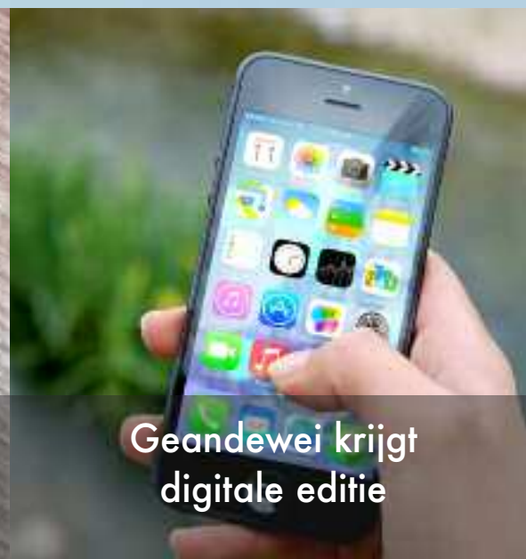
Geandewei krijgt digitale editie