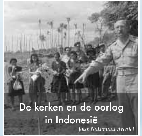
De kerken en de oorlog in Indonesië