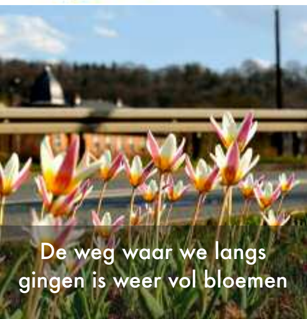
De weg waar we langs gingen is weer vol bloemen