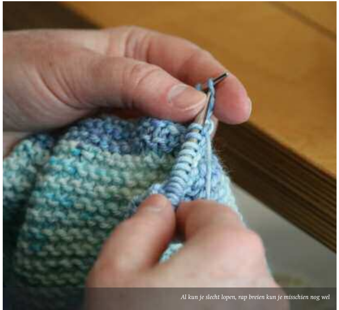
Al kun je slecht lopen, rap breien kun je misschien nog wel

Present Den Haag kent bijvoorbeeld mensen die ooit manager waren bij een groot bedrijf en die nu ze gepensioneerd zijn heel Europa afreizen om te golfen met vrienden. Maar als ze weer eens thuis zijn, kan de eenzaamheid toch toeslaan. Dan is iets gaan doen voor anderen, een goed middel om de eenzaamheid te verdrijven. Bovendien sta je zo aan de ge-