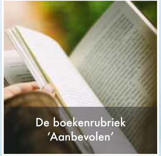
De boekenrubriek 'Aanbevolen'