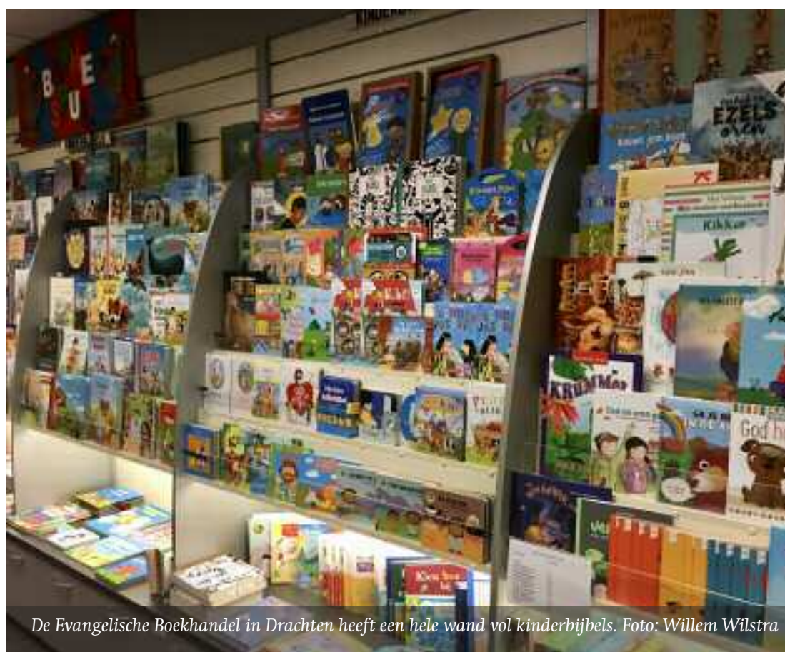
De Evangelische Boekhandel in Drachten heeft een hele wand vol kinderbijbels.

De volgende keer ga ik verder met mijn ontdekkingstocht in de wereld van de kinderbijbels. Dan gaat het over de betrouwbaarheid en de inkleuring van kinderbijbels.