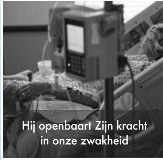
Hij openbaart Zijn kracht in onze zwakheid