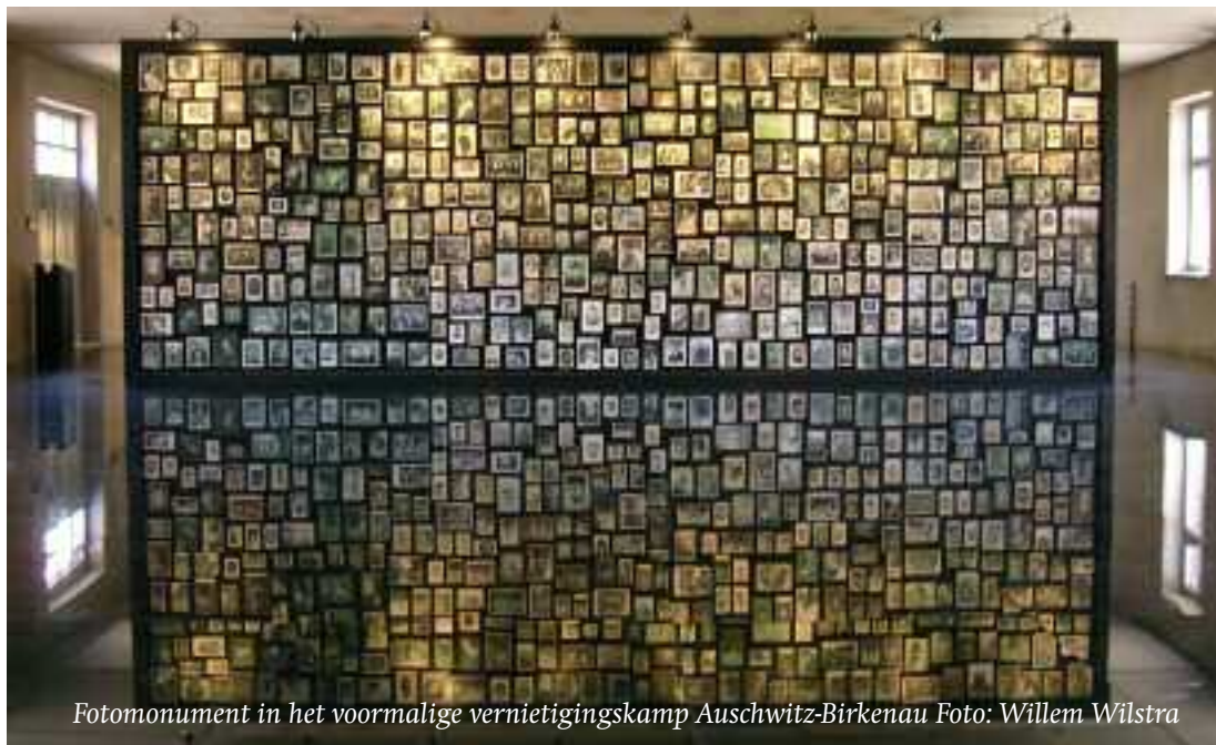
Fotomonument in het voormalige vernietigingskamp Auschwitz-Birkenau

In Nederland zet de Stichting Vrienden van Amcha zich al ruim 40 jaar in voor deze medemensen in Israël. De Stichting - voorzien van het ANBI-keurmerk - heeft giften en donateurs hard nodig. Rekeningnr. NL ABNA 0490606210 tnv Stichting Vrienden van Amcha in Nederland.