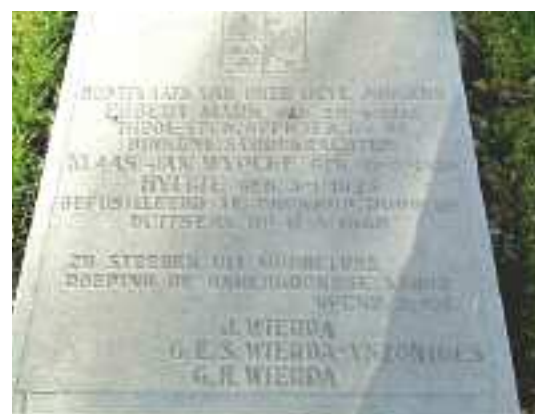
Graf op erehof Noorderbegraafplaats