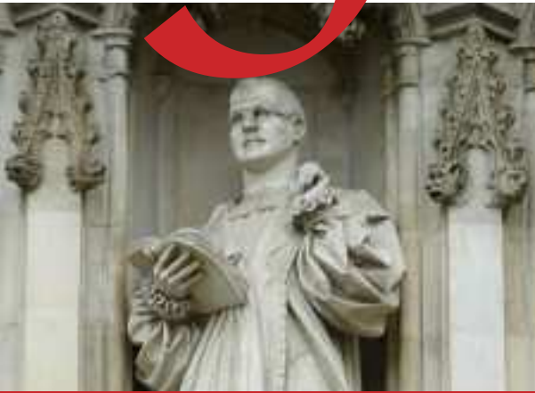
75 jaar na de dood van Dietrich Bonhoeffer