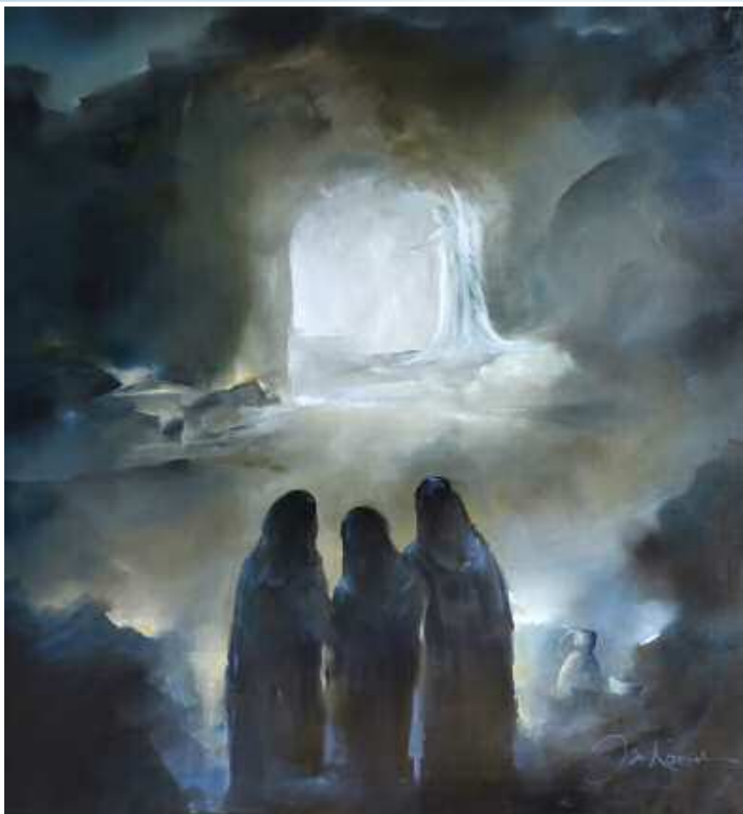
Het graf is leeg!