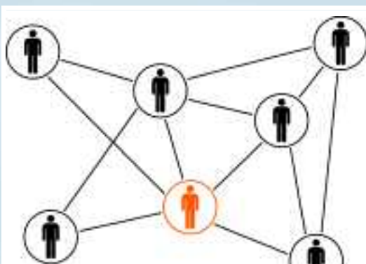
Het netwerk bij elkaar houden in crisistijd