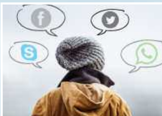
Pastoraat langs digitale weg