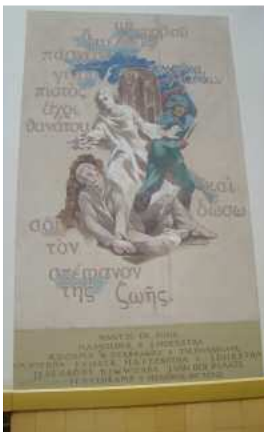
Gedenk wand in de hal van cg Beyers Naudé