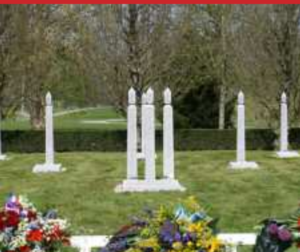
De gebroeders Wierda