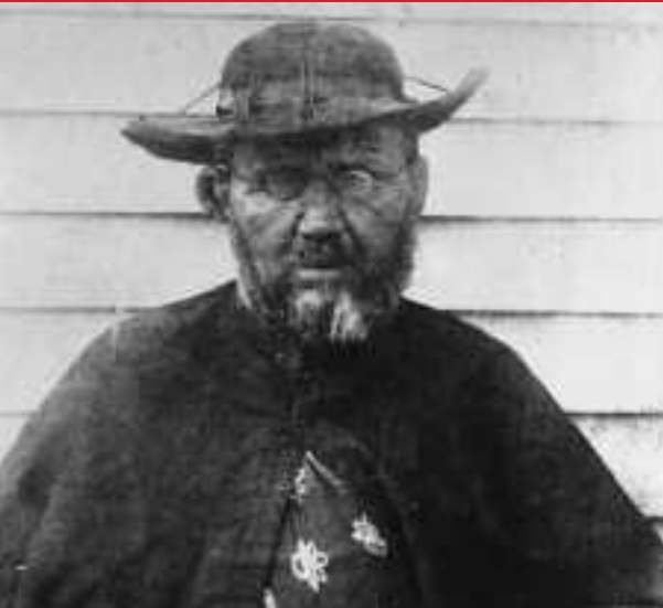
Geloofsgetuige Pater Damiaan