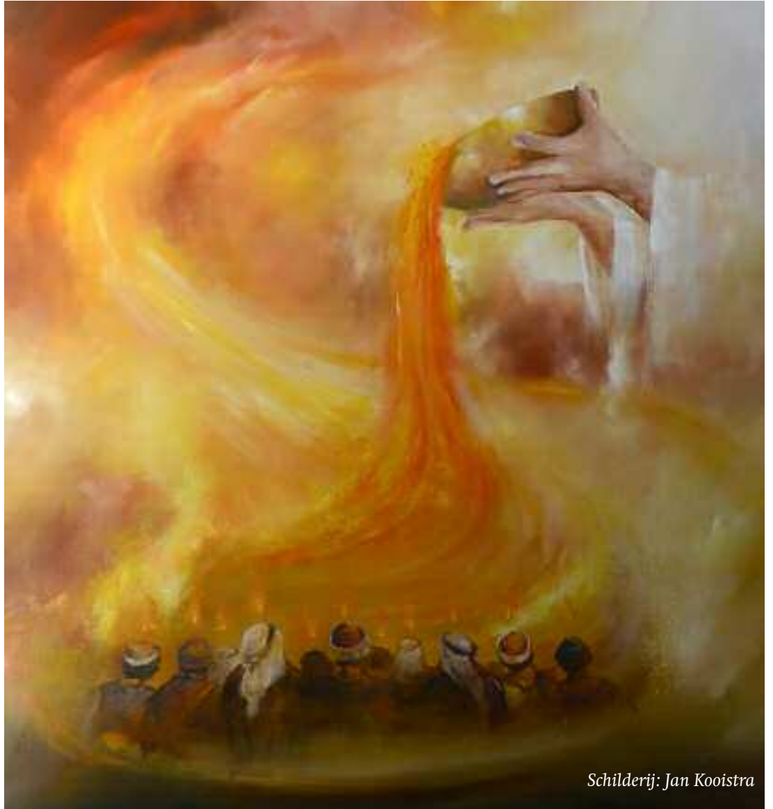
Schilderij: Jan Kooistra

Op het Pinksterfeest hebben de orthodoxe Joden nog steeds twee grote broden (galles), waarover de zegen wordt uitgesproken. Deze broden zijn het symbool van de twee stenen tafelen waarop de tien geboden gegraveerd stonden. Het Pinksterfeest, het Sjawoe'ot , herinnert de gelovige Joden aan het feit dat God bij de berg Sinaï Zijn Woord aan Zijn volk gaf. Israël was er getuige van dat donderslagen en bliksemstralen rond het gebergte verschenen en de berg in rook gehuld was. Het maakte