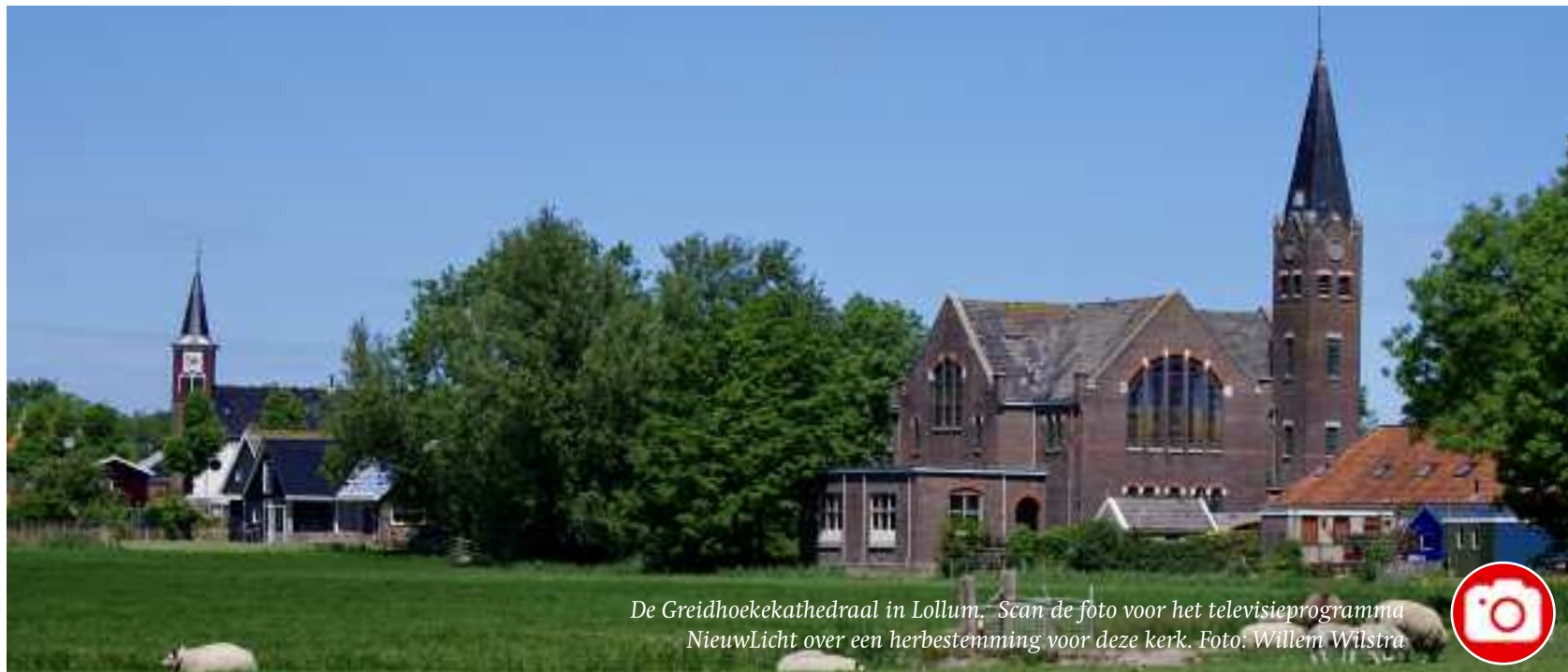
De Greidhoekekathedraal in Lollum. Scan de foto voor het televisieprogramma NieuwLicht over een herbestemming voor deze kerk.

Wilt u ook eens deelnemen aan een digitale netwerksessie? Neem dan contact op met haar opvolger Mark Schippers om afspraken te maken. m.schippers@protestantsekerk.nl / (06) 15 17 93 63.