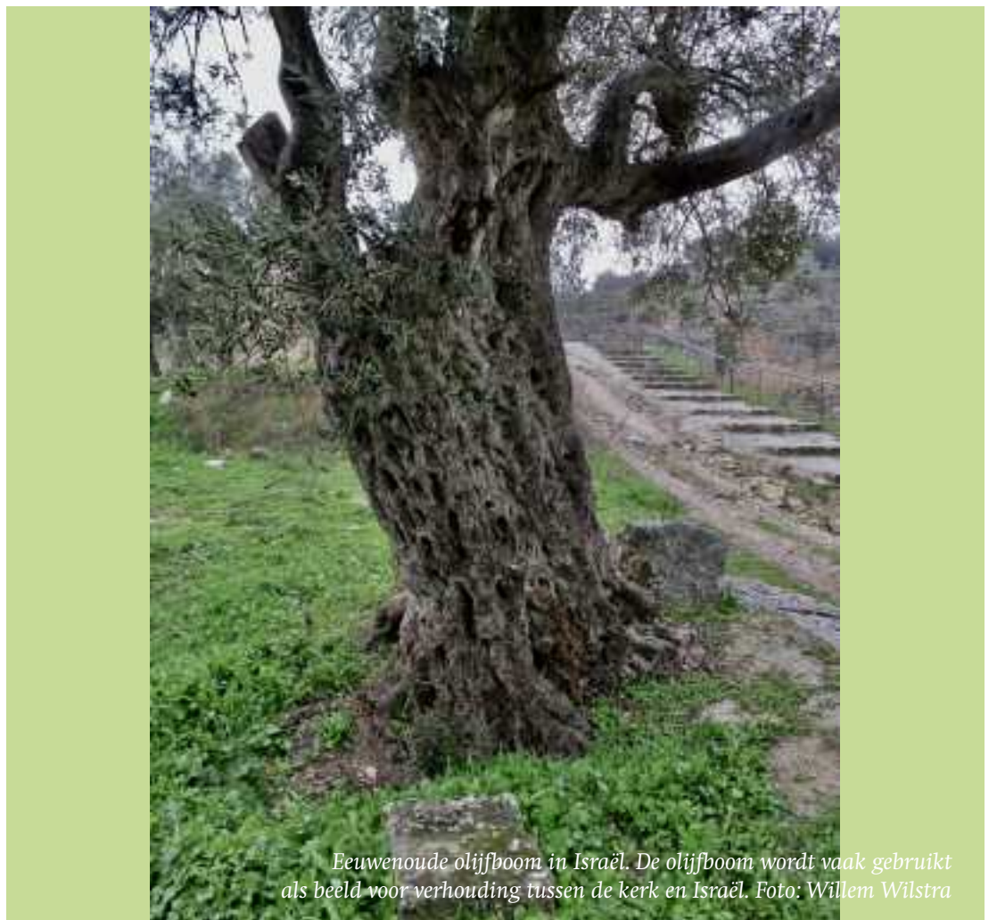
Eeuwenoude olijfboom in Israël. De olijfboom wordt vaak gebruikt als beeld voor verhouding tussen de kerk en Israël.