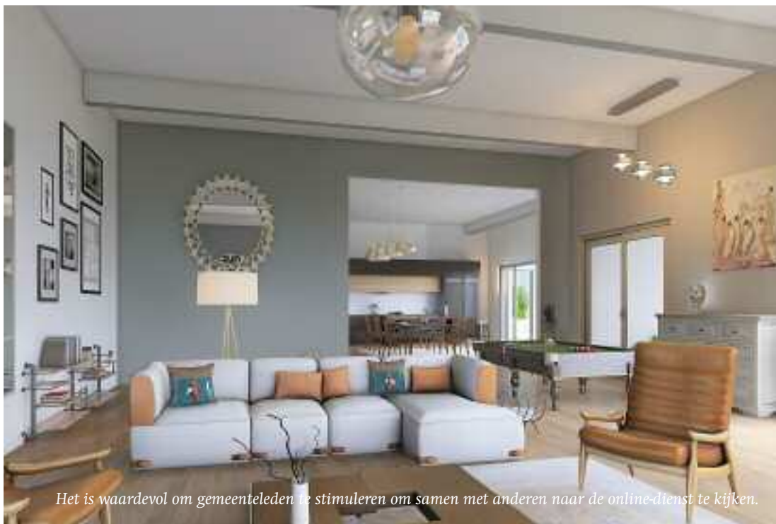
Het is waardevol om gemeenteleden te stimuleren om samen met anderen naar de online-dienst te kijken.

Juist in dit komende seizoen waarbij zekerheden ons uit handen geslagen worden, komt het aan op hoopvol leven in vertrouwen. Gedragen door de belofte, 'door die hoop worden wij gered' (Romeinen 8:24).