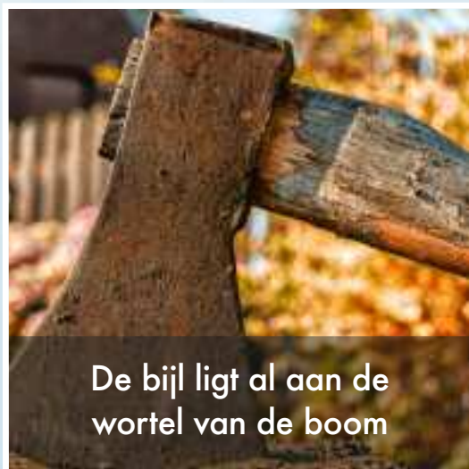
De bijl ligt al aan de wortel van de boom