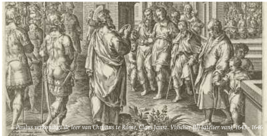
Paulus verkondigt de leer van Christus te Rome, Claes Jansz. Visscher (II) (atelier van), 1643 - 1646