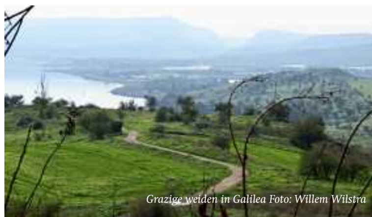
Grazige weiden in Galilea