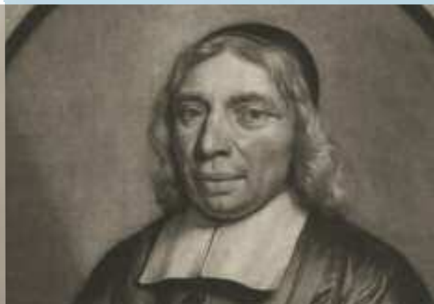
Geloofsgetuige Wilhelmus à Brakel