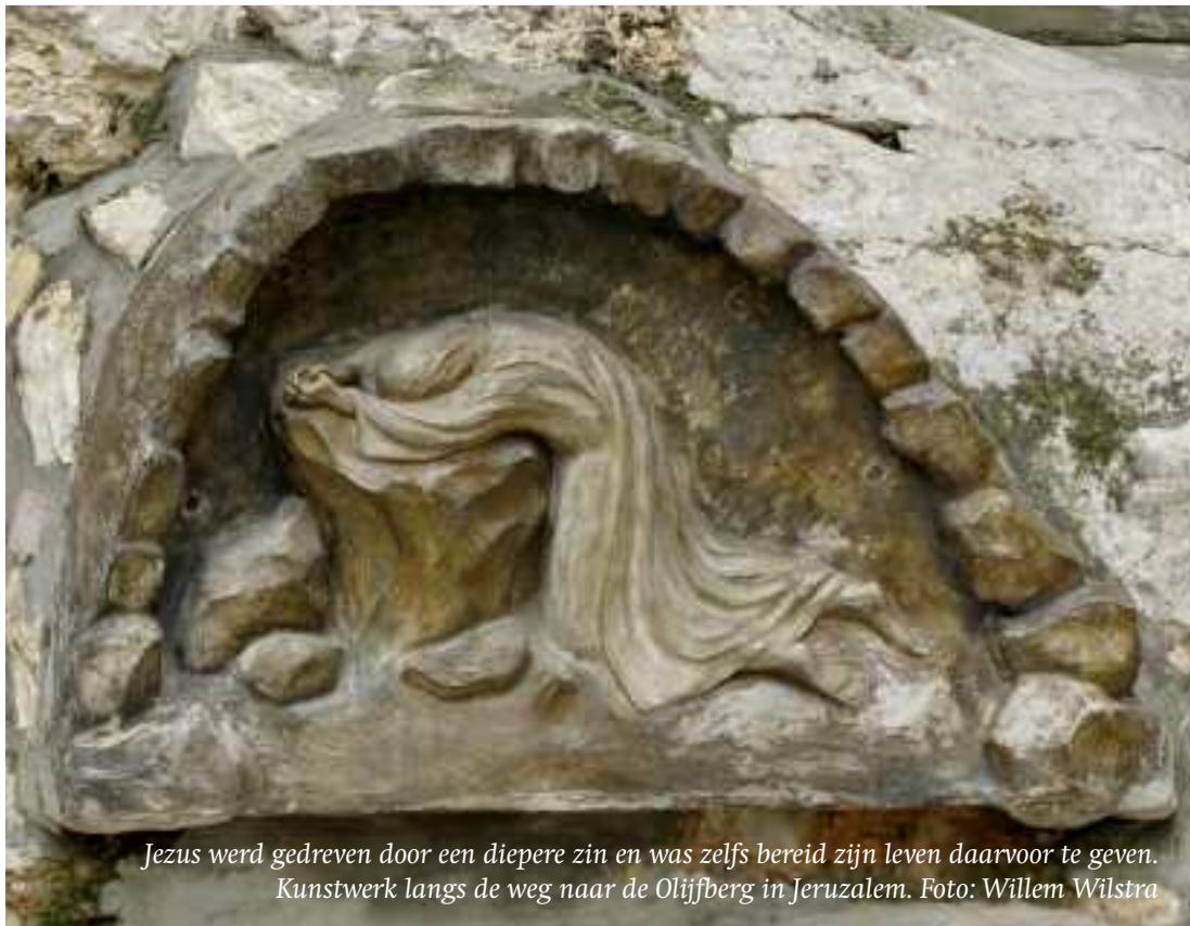
Jezus werd gedreven door een diepere zin en was zelfs bereid zijn leven daarvoor te geven. Kunstwerk langs de weg naar de Olijfberg in Jeruzalem.