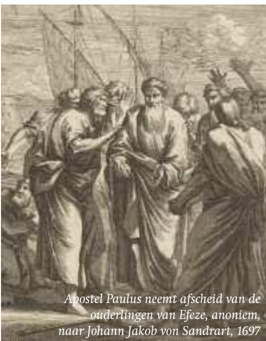
Apostel Paulus neemt afscheid van de ouderlingen van Efeze, anoniem, naar Johann Jakob von Sandrart, 1697

Maar wat nu... als dat kind in die misère geboren is? Wanneer een stal en een kribbe geen kwestie zijn van romantiek en straatprijs, geen staatslot, maar het wrede lot van de harde werkelijkheid waarin dit kind ter wereld kwam? En wat nu als dit kind geen vrolijk fluitend en welvarend leven gaat leiden maar te maken heeft met een bezettingsoorlog? En huilt om het lot van zijn stad?