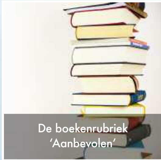
De boekenrubriek 'Aanbevolen'