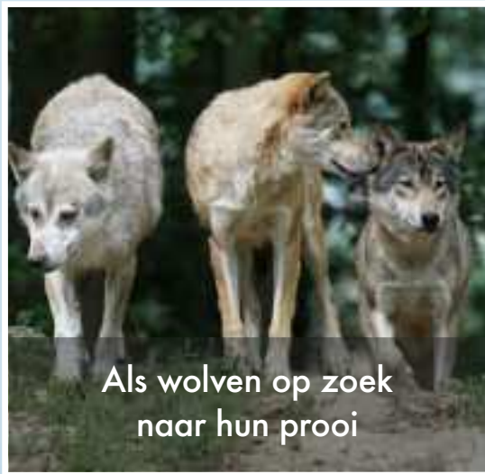
Als wolven op zoek naar hun prooi