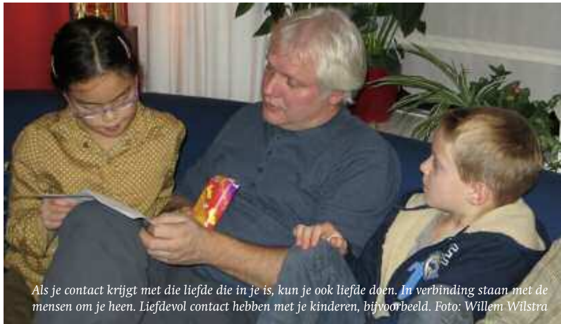
Als je contact krijgt met die liefde die in je is, kun je ook liefde doen. In verbinding staan met de mensen om je heen. Liefdevol contact hebben met je kinderen, bijvoorbeeld.

Een mens is geneigd in zichzelf en voor zichzelf te leven. Maar de liefde keert een mens naar buiten, naar de ander. De liefde is bij Jezus heel radicaal, met een driedubbele focus: