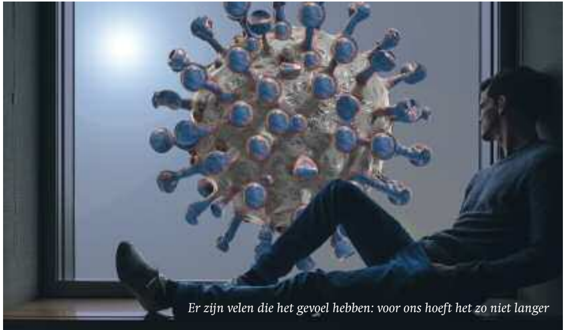
Er zijn velen die het gevoel hebben: voor ons hoeft het zo niet langer

Het zou helemaal niet zo'n gek idee zijn, nu we voorlopig nog niet tijdens kerkdiensten kunnen zingen, om het als gezin samen aan de keukentafel te doen. Vroeger deed men dat