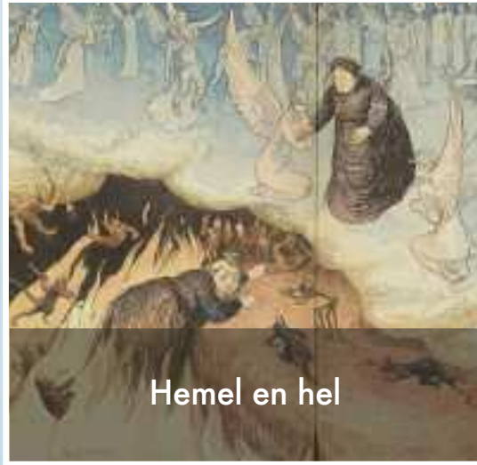
Hemel en hel