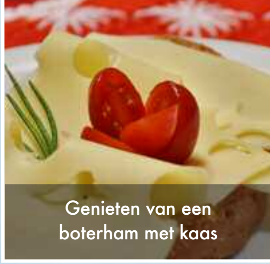
Genieten van een boterham met kaas