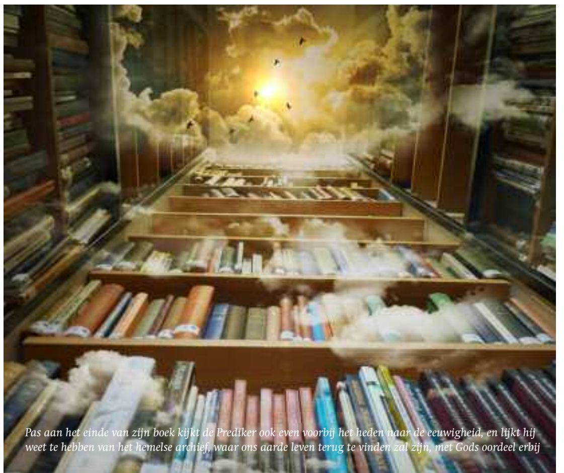
Pas aan het einde van zijn boek kijkt de Prediker ook even voorbij het heden naar de eeuwigheid, en lijkt hij weet te hebben van het hemelse archief, waar ons aarde leven terug te vinden zal zijn, met Gods oordeel erbij