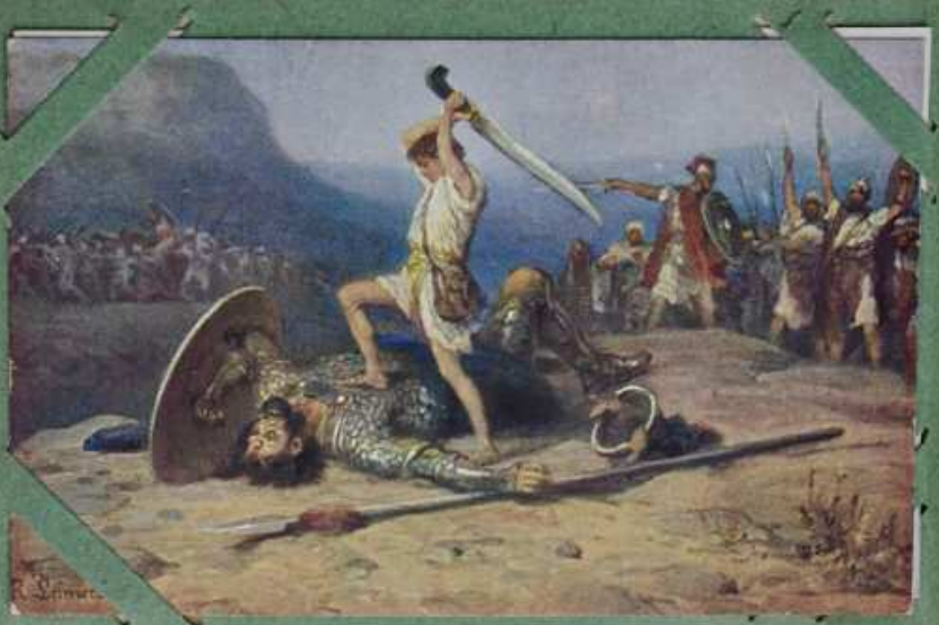
6. David und Goliath , 1. Samuëls 17, 51. David nahm des Riesen Schwert und bieh ihm den Kopf ab. Flucht der Philister. Jubel der Israeliten.

Jaargang 28 - nummer 9 vrijdag 7 mei 2021 editie Leeuwarden