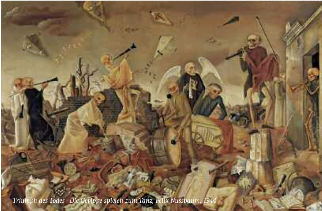
Triumph des Todes - Die Gerippe spielen zum Tanz, Felix Nussbaum, 1944

In zeshonderd Duitse dorpen en steden is een straatnaam te vinden die aan Hans en Sophie Scholl herinnert. Zo zijn zij tot nationale helden geworden.