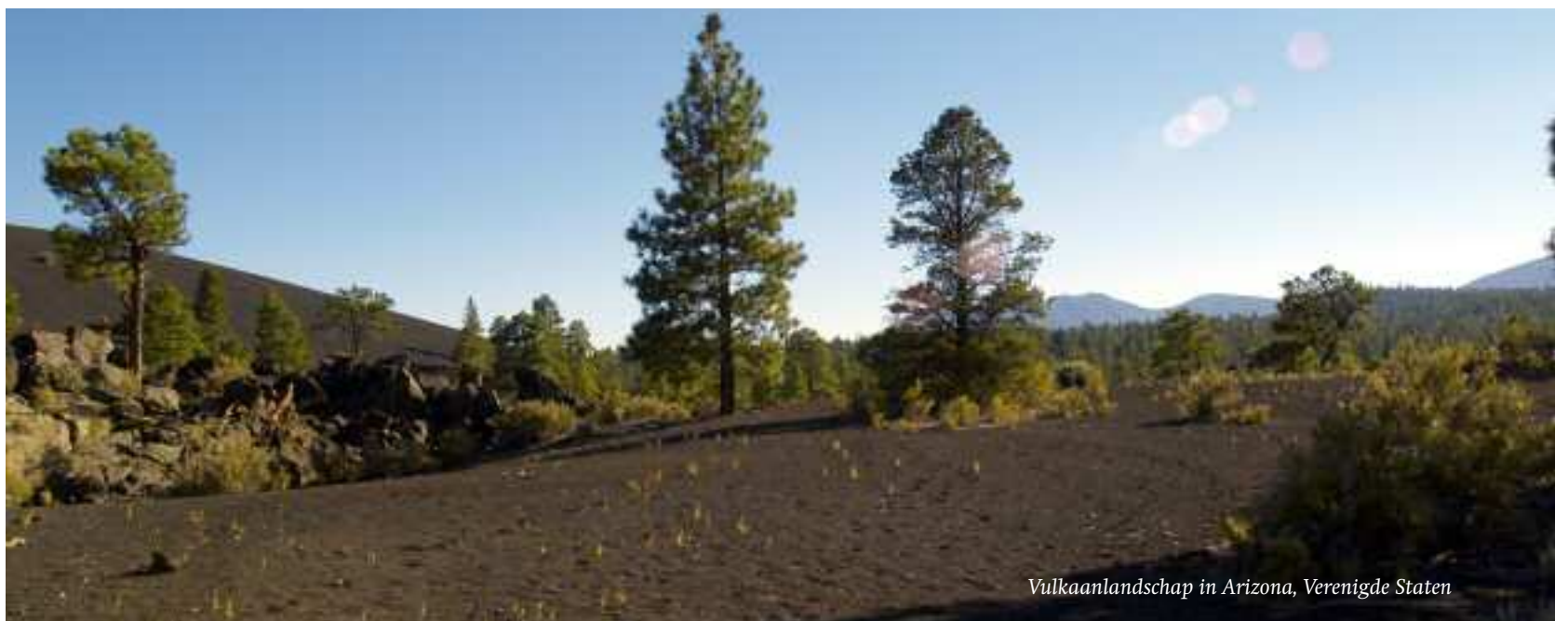
Vulkaanlandschap in Arizona, Verenigde Staten