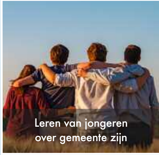
Leren van jongeren over gemeente zijn