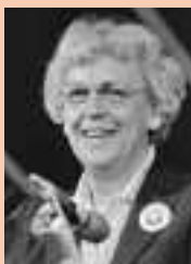
Rita C. Cries / Anefo - NABIMAAI Archief

'Het gaat om een mentaliteitsverandering. Een cultuur en een kerk veranderen niet in een handomdraai'