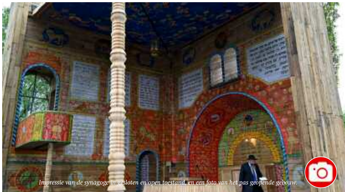
Impressie van de synagoge in gesloten en open toestand, en een foto van het pas geopende gebouw.