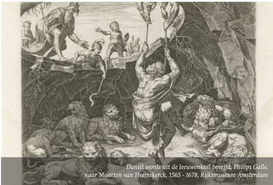
Daniël wordt uit de leeuwenkuil bevrijd, Philips Galle, naar Maarten van Heemskerck, 1565 - 1678, Rijksmuseum Amsterdam

Het eerste artikel over persoonsnamen en geloof in God verscheen in Geandewei 11-2021