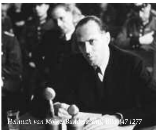
Helmuth van Molke