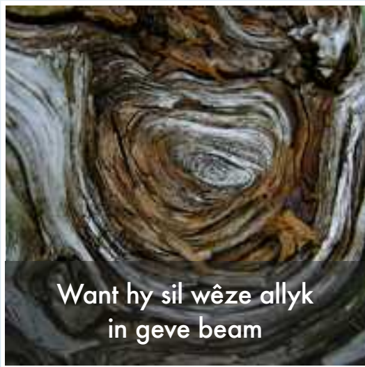
Want hy sil wêze allyk in geve beam