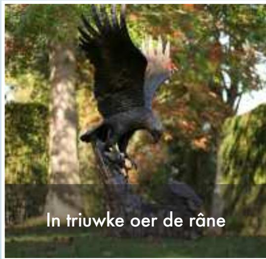
In triuwke oer de râne