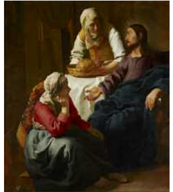
Johannes Vermeer, Christus in het huis van Martha en Maria, ca. 1655, olieverf op doek, 160 x 142 cm, National Galleries of Scotland, Edinburgh

Jezus vertelt niet wat dat ene is dat nodig is. Maar duidelijk is wel uit het verhaal, dat Jezus weet wat wij nodig hebben.