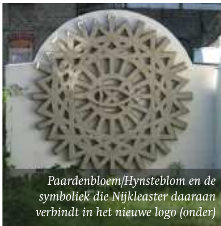
Paardenbloem/Hynstebloom en de symboliek die Nijkleaster daaraan verbindt in het nieuwe logo (onder)