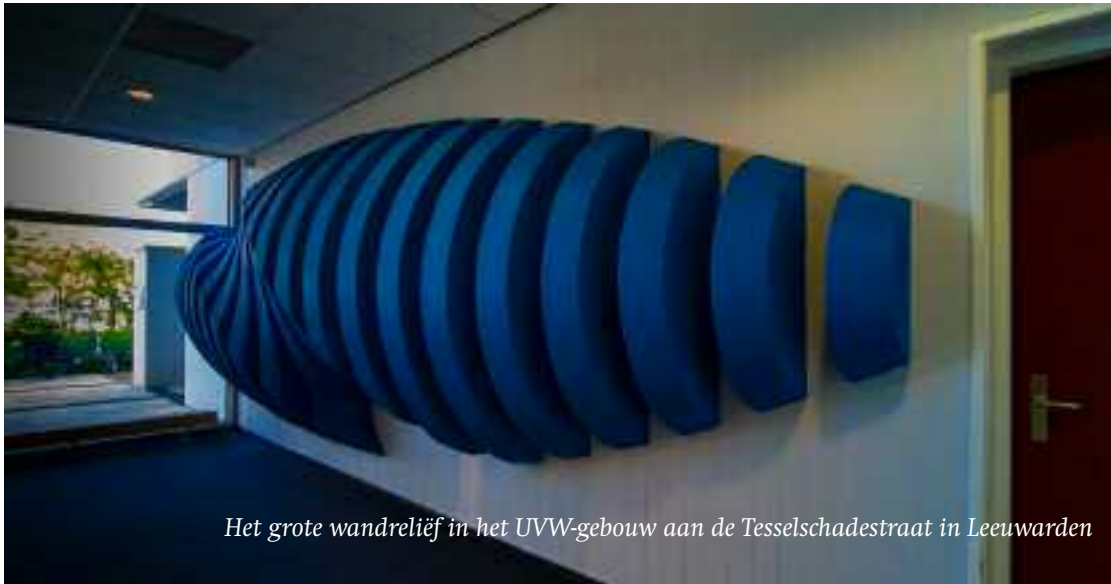
Het grote wandreliëf in het UWV-gebouw aan de Tesselschadestraat in Leeuwarden