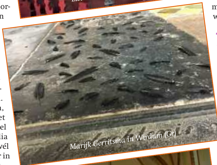
Marijk Gerritsma in Wirdum (Gr)