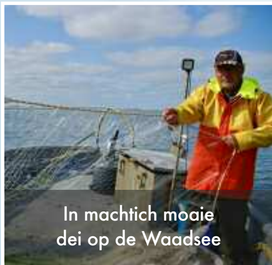
In machtich moaie dei op de Waadsee