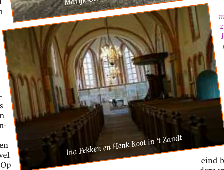
Ina Fekken en Henk Kooi in 't Zandt

In het eerste jaar waren het vier kerken die middels een fietsrondje op een avond prima te bezoeken waren. De volgende jaren kwam er nog een rondje van vijf kerken bij, en dit jaar is er ook een rondje in Noordoost-Fryslân (Oostrum, Jouswier, Aalsum en de Bonifatiuskapel in Dokkum).