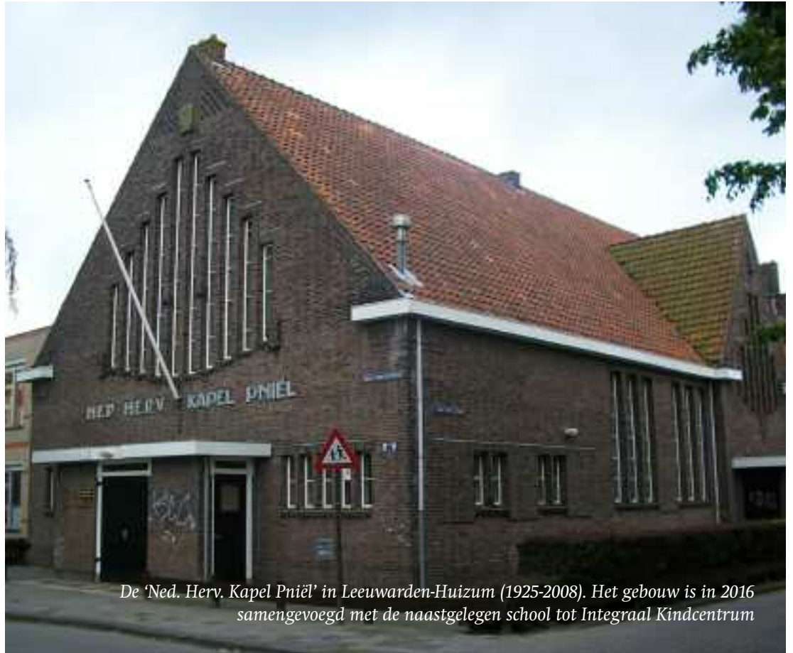
De 'Ned. Herv. Kapel Pniël' in Leeuwarden-Huizum (1925-2008). Het gebouw is in 2016 samengevoegd met de naastgelegen school tot Integraal Kindcentrum