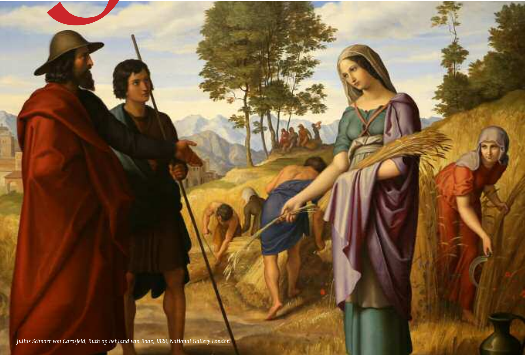
Julius Schnorr von Carosfeld, Ruth op het land van Boaz, 1828, National Gallery London

Jaargang 28 - nummer 16 vrijdag 10 september 2021 editie Leeuwarden e.o.