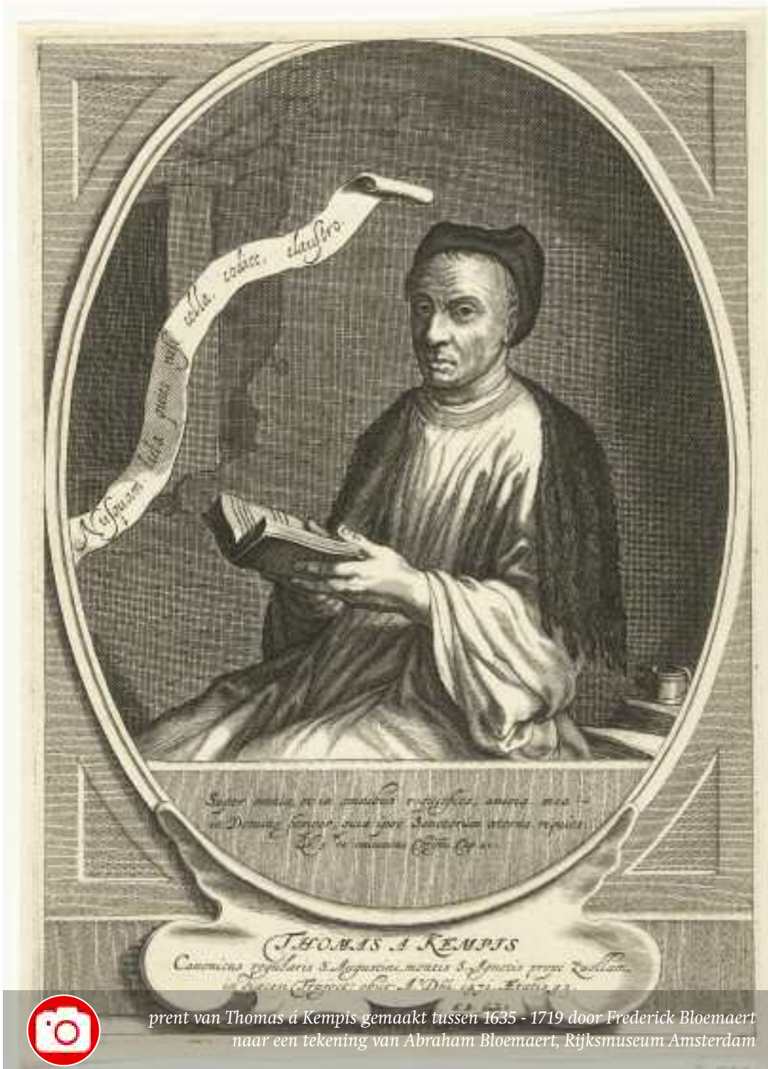
prent van Thomas à Kempis gemaakt tussen 1635 - 1719 door Frederick Bloemaert naar een tekening van Abraham Bloemaert, Rijksmuseum Amsterdam

keer de gehele Bijbel, tussen 1427 tot 1439, een monsterklus om al die teksten met fraaie letters op perkament aan te brengen. Een Bijbel is bewaard gebleven, deze is te bewonderen in de Hessische Hochschule und Landesbibliothek van Darmstadt.