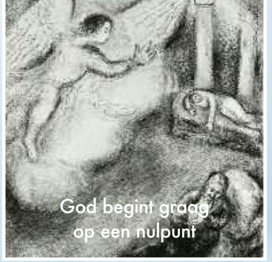
God begint graag op een nulpunt

Een vroeg spoor van het christendom in Fryslân