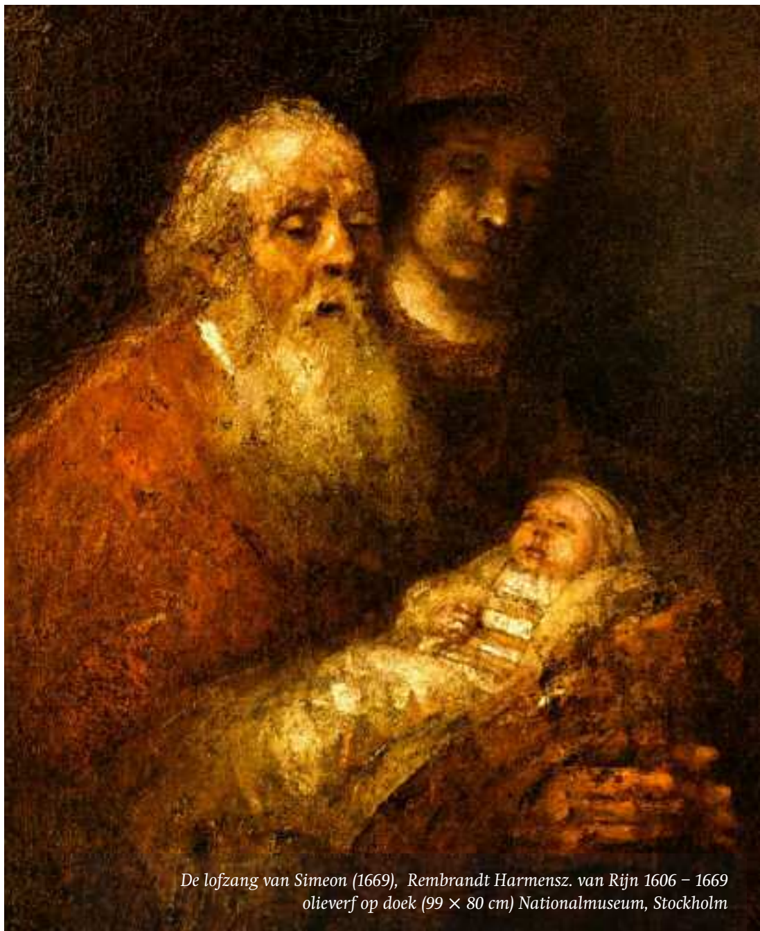
De lofzang van Simeon (1669), Rembrandt Harmensz. van Rijn 1606 – 1669 olieverf op doek (99 × 80 cm) Nationalmuseum, Stockholm