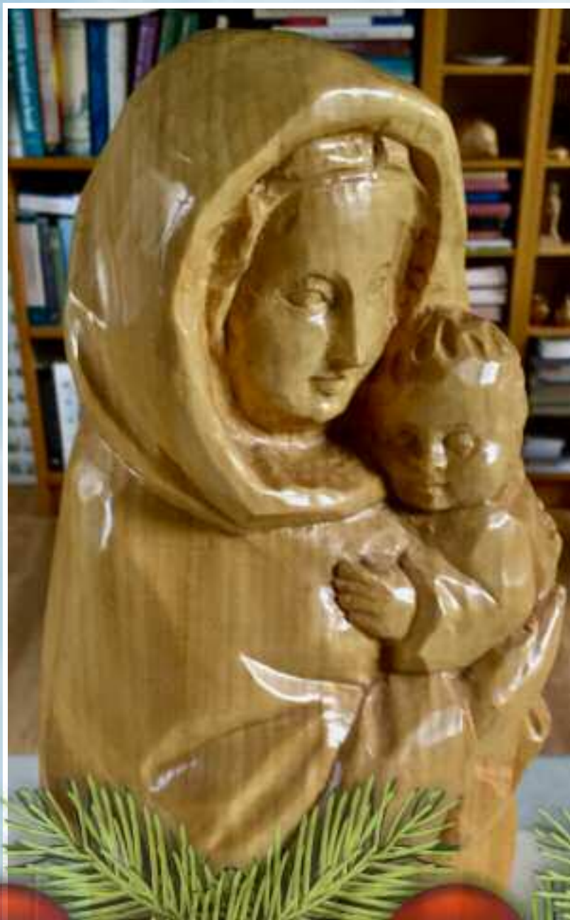
Maria met Kind, houtsnijwerk van wijlen Roel Visser.

Wensen u gezegende Kerstdagen en folle lok en seine foar 2022