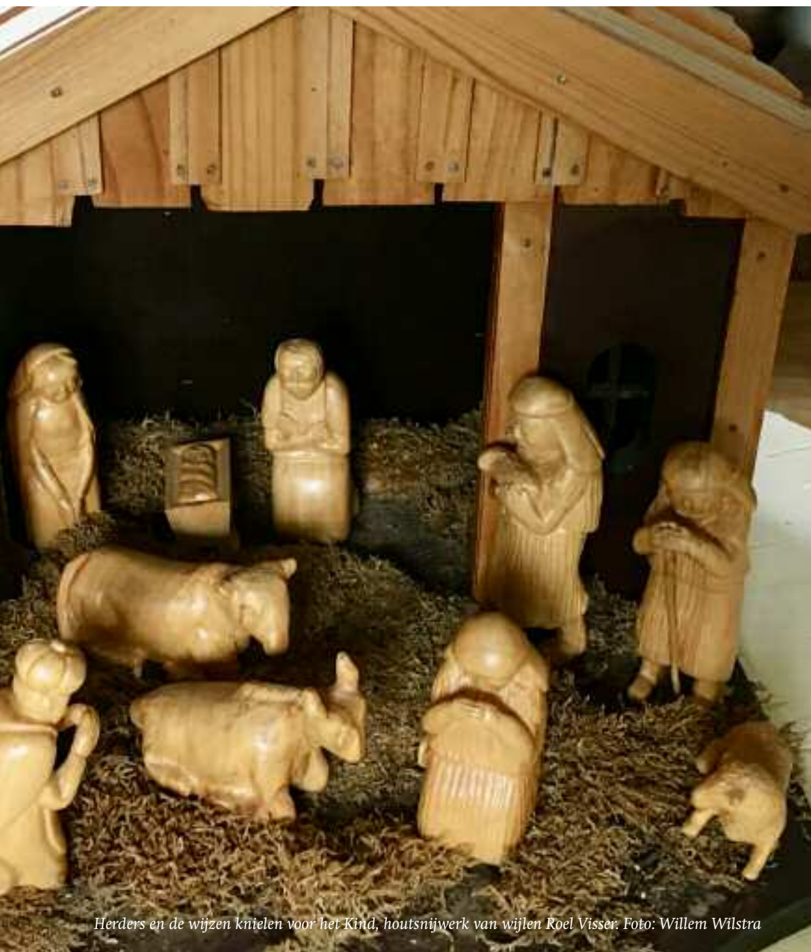
Herders en de wijzen knielen voor het Kind, houtsnijwerk van wijlen Roel Visser.

daarna ook anders en nieuw verloopt. Geloven als een kind is niet hetzelfde als denken als een volwassene. Helaas zijn niet alle beleidsmakers van plan om zich te laten beïnvloeden door het kind en zich dus te laten omvormen, omdat die omvorming (bekering) voor hen niet acceptabel is. Een koning knielt immers niet. Knielen is iets voor herders. Maar dan ben je en doe je niet wijs en val je onder de schifting en scheiding die Jezus later tussen koppige bokken en trouwe schapen zal maken.