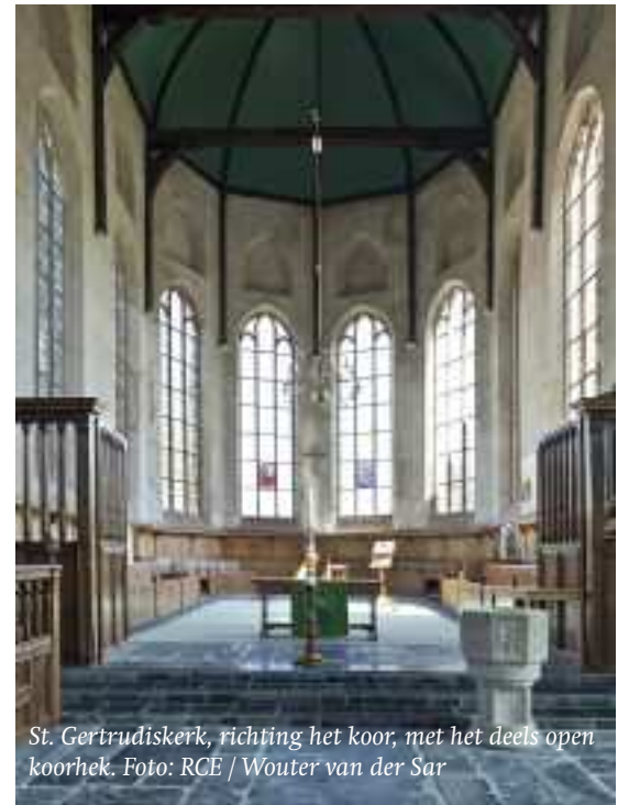
St. Gertrudiskerk, richting het koor, met het deels open koorhek.

'Raker had hij op dit door twijfel ontwrichte moment niet aangesproken kunnen worden. 'Kom verder!' In die aansporing klonk direct de bemoediging door waar hij ten diepste behoefte aan had. Een simpel blijk van vertrouwen: Je mag er zijn! Kom verder!', aldus Freek.