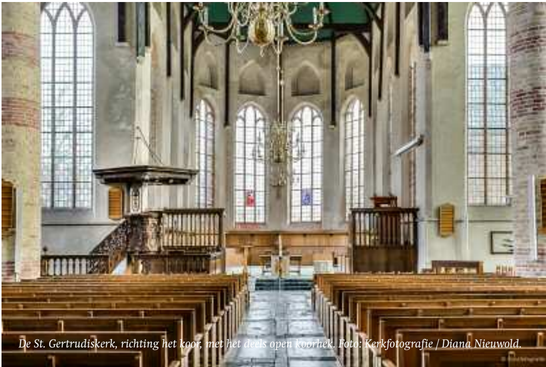
De St. Gertrudiskerk, richting het koor, met het deels open koorhek.