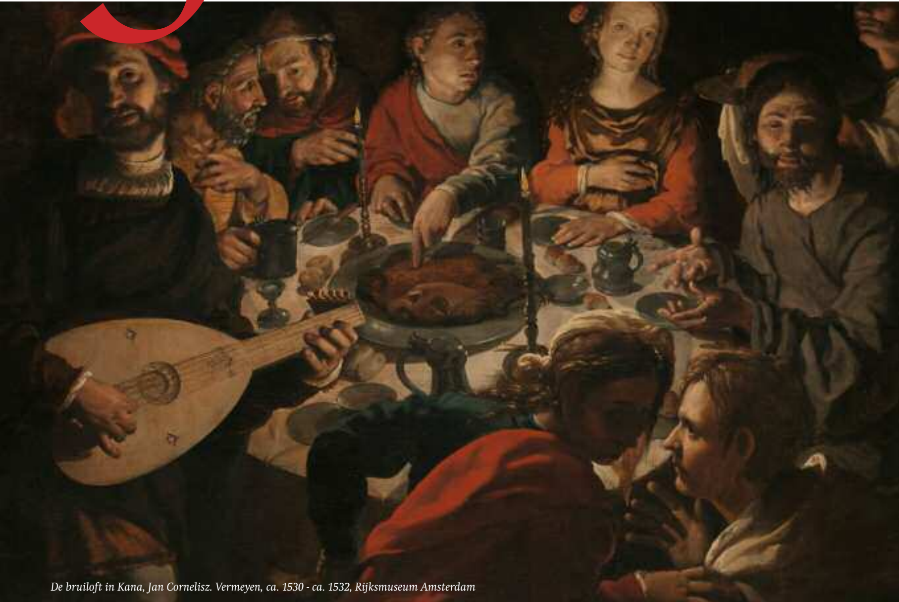
De bruiloft in Kana, Jan Cornelisz. Vermeyen, ca. 1530 - ca. 1532, Rijksmuseum Amsterdam