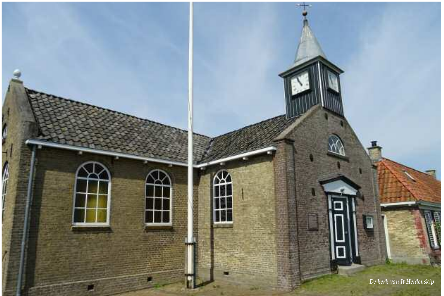
De kerk van It Heidenskip