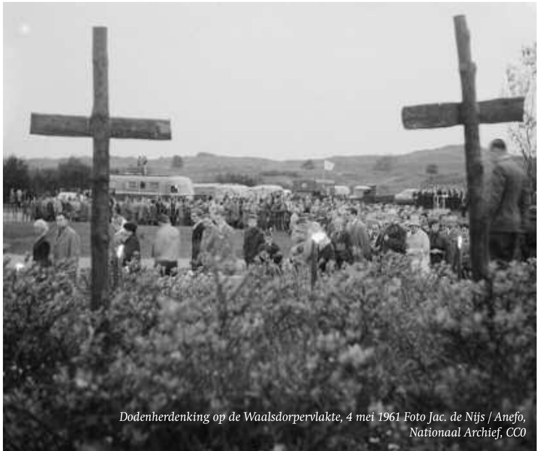
Dodenherdenking op de Waalsdorpervlakte, 4 mei 1961

Met concepten als ‘publieke religie’ en ‘invisible religion’ proberen De Jager en Wallet duidelijk te maken dat religie in Nederland niet alleen een bron van spanningen en verdeeldheid was, maar ook van nationale eenheid. Overigens is de wetenschappelijke studie van de manier waarop de Tweede Wereldoorlog in