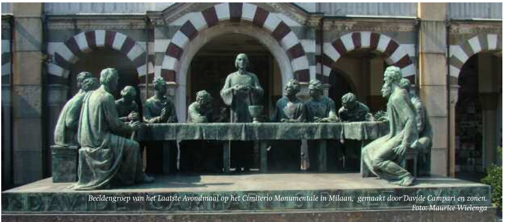
Beeldengroep van het Laatste Avondmaal op het Cimiterio Monumentale in Milaan, gemaakt door Davide Campari en zonen.

Jezus betaalde met zijn lijden een hoge prijs. Hij verwacht van ons dat we zo leven dat wij zonder verschrikken voor het aangezicht van Hem kunnen verschijnen. Daarvoor is de dagelijkse bekering noodzakelijk.