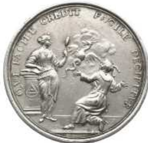
Gedenkpenning voor Balthasar Bekker uit 1698