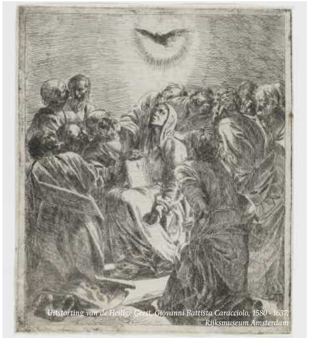
Uitstorting van de Heilige Geest, Giovanni Battista Caracciolo, 1580 - 1637, Rijksmuseum Amsterdam

Petrus kan bijna niet boven het tumult uitkomen en maant tot kalmte. Hij zegt: 'Deze Jezus die jullie vervolgd hebben, is door Gods rechterhand verhoogd. En deze heeft de komst van de Heilige Geest beloofd. Welnu, deze is nu gekomen. Jullie zijn er getuige van. Je ziet het en hoort het. En nu moet heel het huis Israël, ja heel de kerk weten, dat God Hem tot Heer en Christus gemaakt heeft, die-