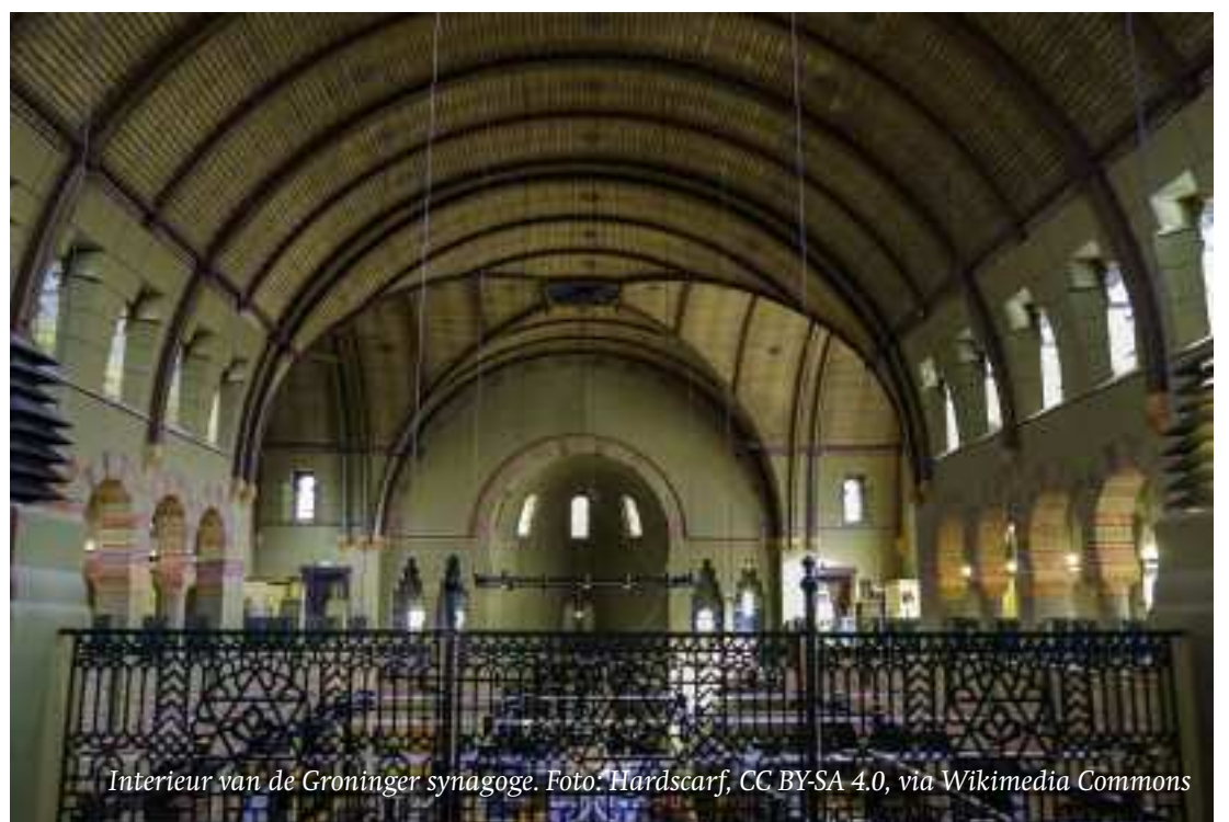
Interieur van de Groninger synagoge.