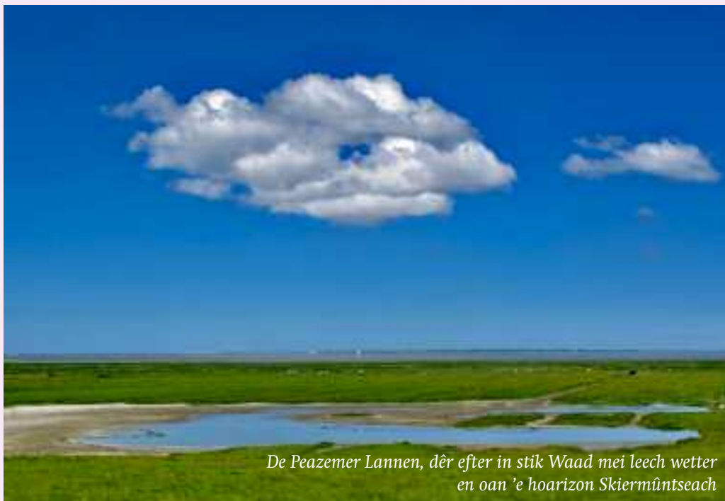
De Peazemer Lannen, dêr efter in stik Waad mei leech wetter en oan 'e hoarizon Skiermûntseach