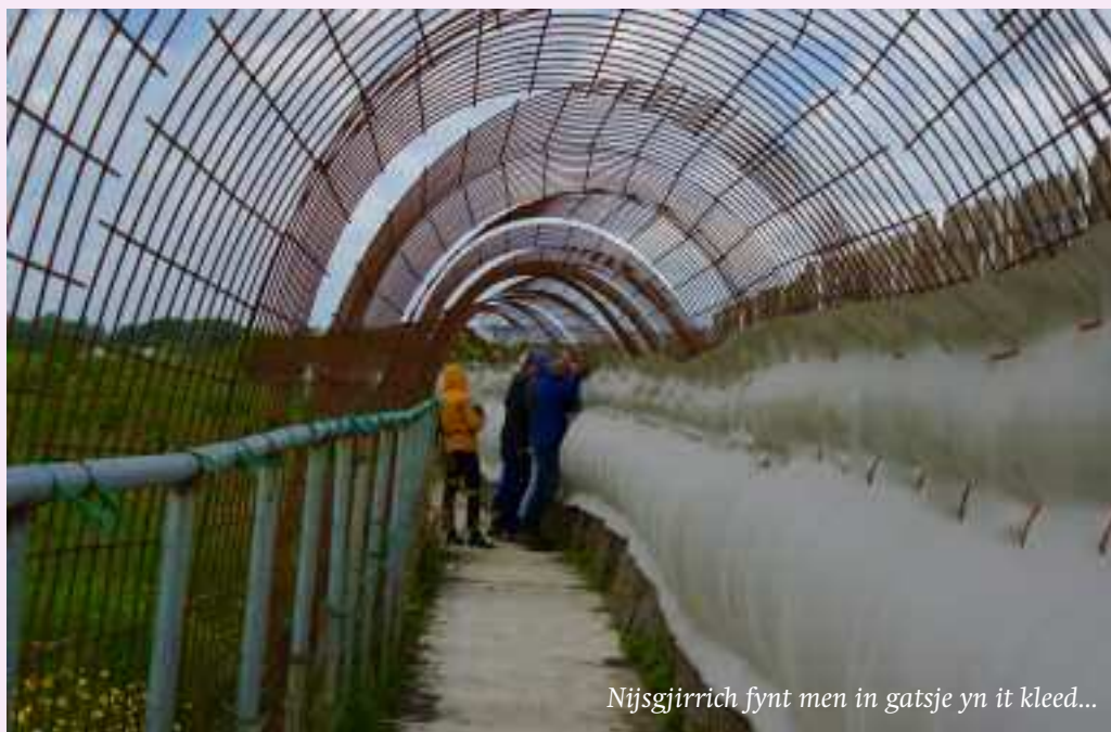
Nijsgjirrich fynt men in gatsje yn it kleed...

'Moai, sûnder wjergea binne de Wâlden: Smûk skaadzjend beam-te-grien oeral yn 't rûn. Blier laitsjend boulân, tierige greiden, sjongende fûgels, sânich de grûn.'