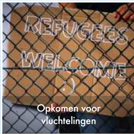
Opkomen voor vluchtelingen