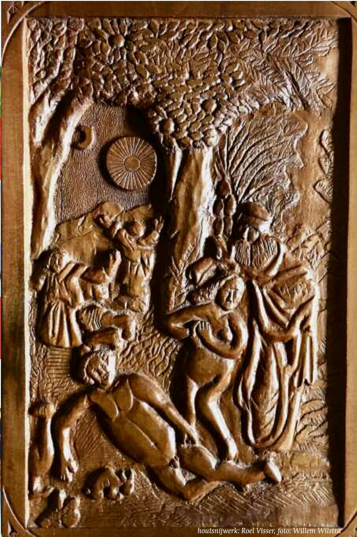
houtsnijwerk: Roel Visser; foto: Willem Wilstra