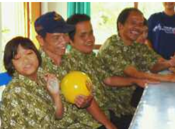
25 jaar stichting Camelia