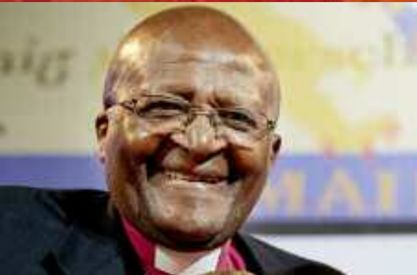
Geloofsgetuige Desmond Tutu