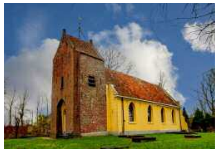
De kerken van Eenrum (links), Den Aniel (boven) en Westernieland.