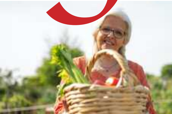
Volgelingen van Jezus gaan niet met pensioen