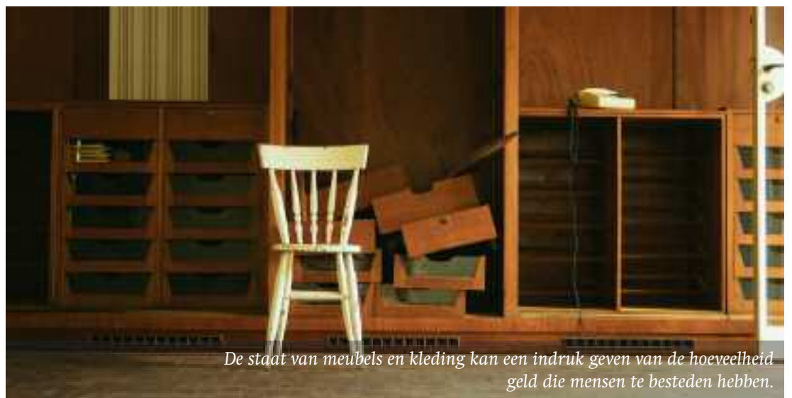
De staat van meubels en kleding kan een indruk geven van de hoeveelheid geld die mensen te besteden hebben.