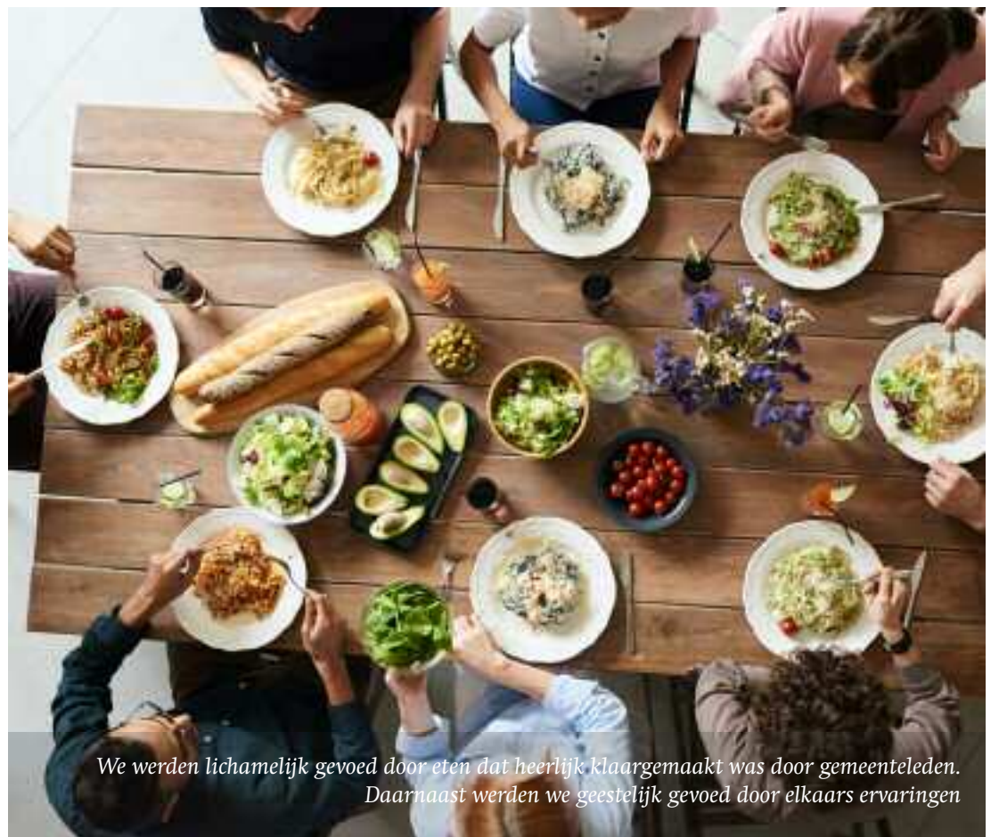
We werden lichamelijk gevoed door eten dat heerlijk klaargemaakt was door gemeenteleden. Daarnaast werden we geestelijk gevoed door elkaars ervaringen

Nelleke Berntsen uit Leeuwarden is gepensioneerd docente levensbeschouwing en redactielid van Geandewei