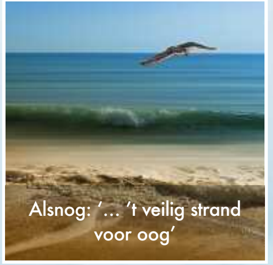
Alsnog: '... 't veilig strand voor oog'

Als wij niet zorgen voor de schepping, zorgt de schepping ook niet meer voor ons