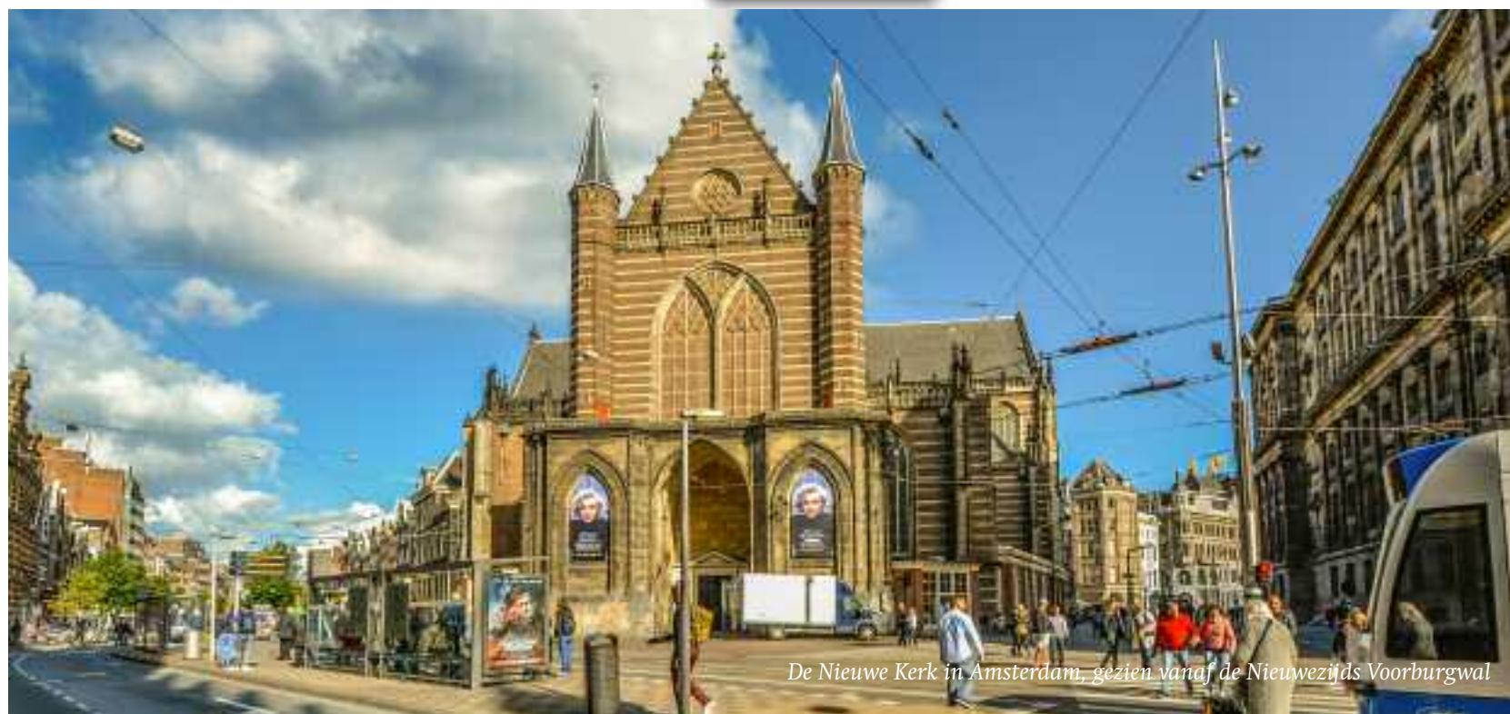
De Nieuwe Kerk in Amsterdam, gezien vanaf de Nieuwezijds Voorburgwal

Referentie: Het Vergrijp der Zeventien Ouderlingen. Memorie van de Amsterdamschen Kerkeraad der Nederduitsche Hervormde Gemeente. In zake het adres van de HH. G. H. Kuiper c.s. voor den kerkeraad gesteld door Dr. A. Kuiper. Uitgever: H. de Hoogh & Co, Amsterdam, 1872. Prijs 90 cents.