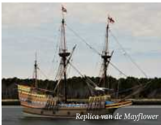
Replica van de Mayflower

Op enkele plaatsen heeft men met succes geprobeerd de herinnering aan de Pilgrim Fa-