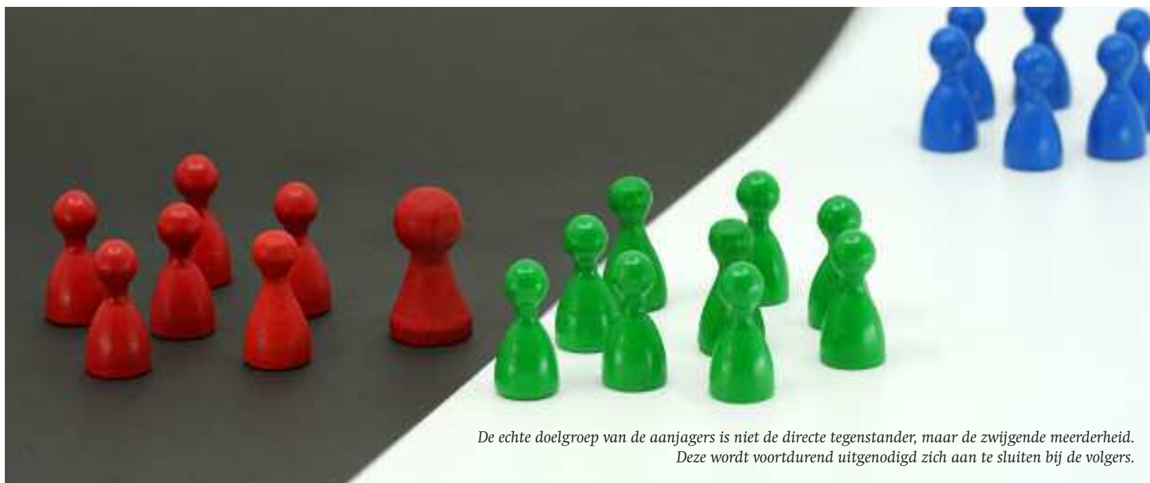
De echte doelgroep van de aanjagers is niet de directe tegenstander, maar de zwijgende meerderheid. Deze wordt voortdurend uitgenodigd zich aan te sluiten bij de volgers.