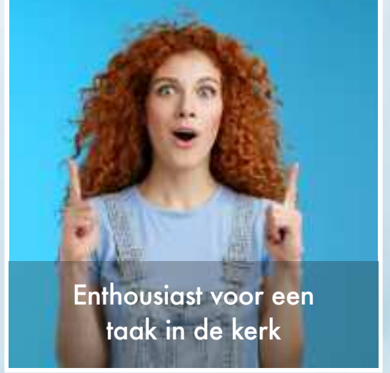
Enthousiast voor een taak in de kerk

Hoe lastig is het om je aan je voornemens te houden?!