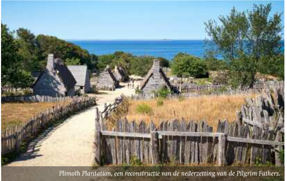
Plimoth Plantation, een reconstructie van de nederzetting van de Pilgrim Fathers.

Vanuit Delfshaven (nu een stadsdeel van Rotterdam), waar nog een gedenkteken in de kerk aan hen herinnert, vertrokken ze naar Plymouth in Zuid-Engeland. Daar sloot een groep gelijkgezinden zich bij hen aan. Op 6 september 1620 staken ze met ruim honderd