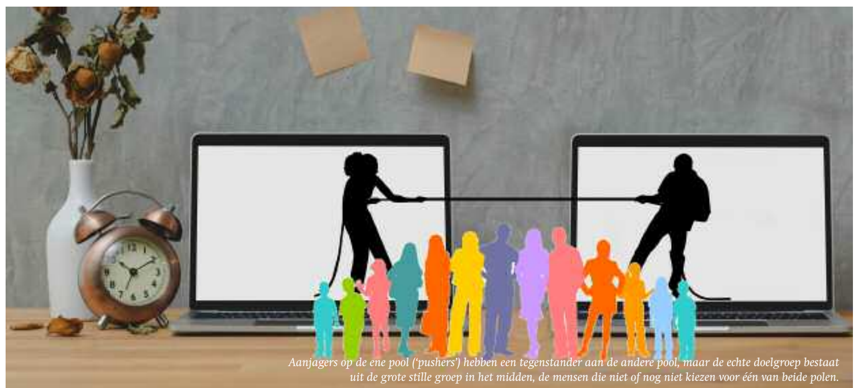
Aanjagers op de ene pool ('pushers') hebben een tegenstander aan de andere pool, maar de echte doelgroep bestaat uit de grote stille groep in het midden, de mensen die niet of nog niet kiezen voor één van beide polen.

Geandewei 3 met het eerste artikel is nog terug te lezen in de Geandewei-app of via geandewei.nl