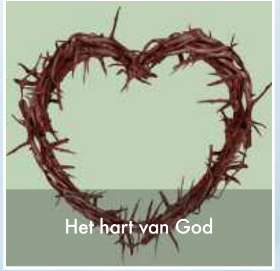
Het hart van God

Vinden wij het nog belangrijk om over Jezus te vertellen?