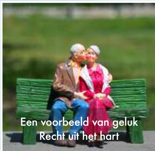
Een voorbeeld van geluk Recht uit het hart