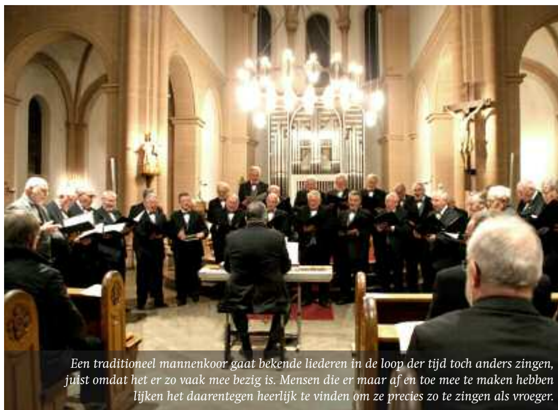
Een traditioneel mannenkoor gaat bekende liederen in de loop der tijd toch anders zingen, juist omdat het er zo vaak mee bezig is. Mensen die er maar af en toe mee te maken hebben lijken het daarentegen heerlijk te vinden om ze precies zo te zingen als vroeger.