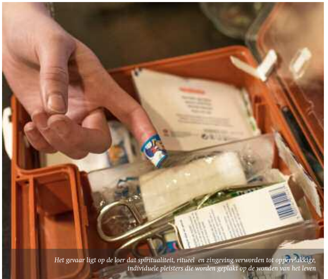
Het gevaar ligt op de loer dat spiritualiteit, ritueel en zingeving verworden tot oppervlakkige, individuele pleisters die worden geplakt op de wonden van het leven