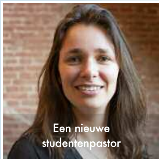
Een nieuwe studentenpastor