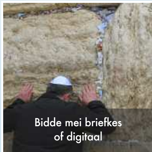
Bidde mei briefkes of digitaal