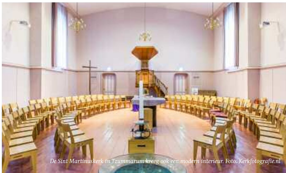
De Sint Martinuskerk in Tzummarum kreeg ook een modern interieur.

Wat er in die ontmoetingen allemaal is gebeurd, daarover verhalen de stenen niets. Ze waren er om het te faciliteren, en verder hebben ze zwijgplicht. Er zijn dingen die te persoonlijk, te intiem zijn om aan de grote klok te hangen. Maar zolang de gebouwen er staan, staan ze voor de ontmoeting open. En als wij de deuren openen voor ieder die binnen wil komen, wordt verder gebouwd aan dat eeuwenlange verhaal.