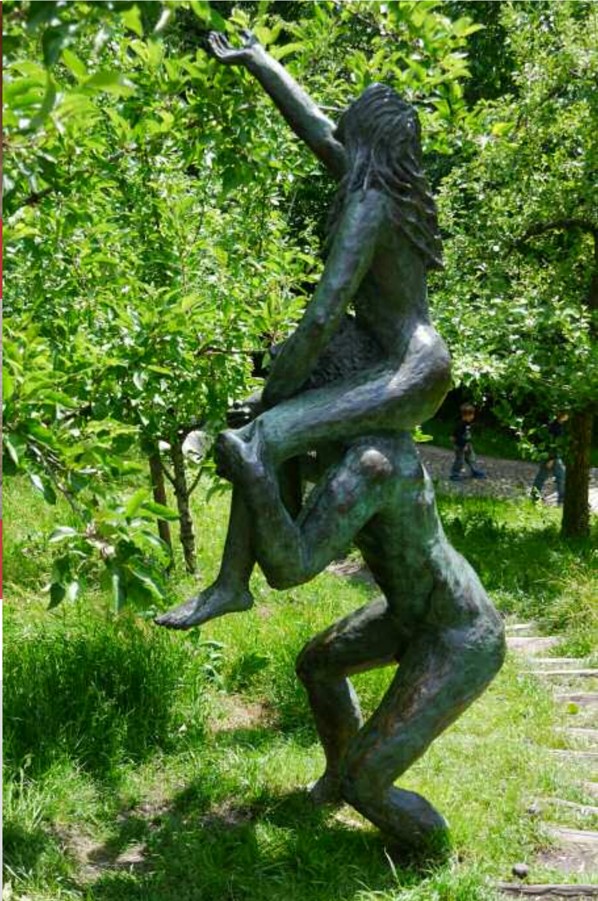
Het leven zoals God het bedoeld had