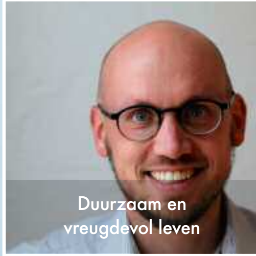
Duurzaam en vreugdevol leven