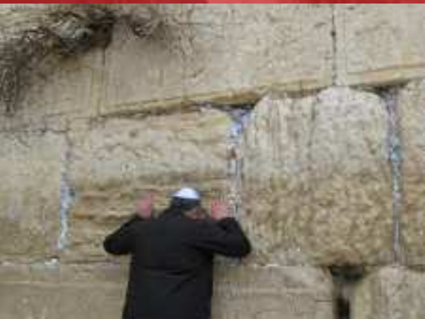
Analoog of digitaal bidden