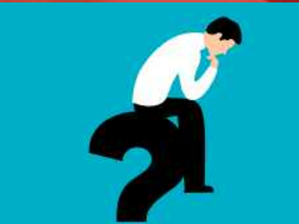
Aandacht voor bestaansonzekerheid