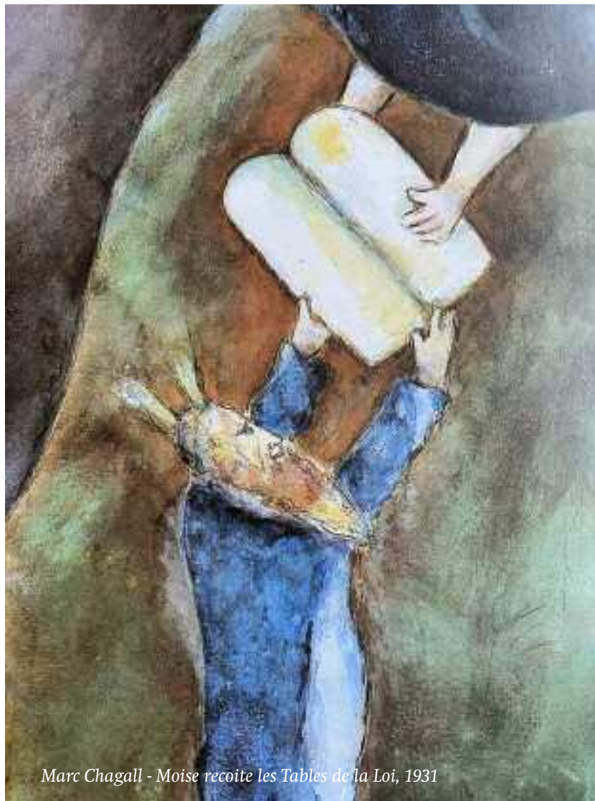
Marc Chagall - Moïse recueille les Tables de la Loi, 1931

De gelovige in Psalm 119 kiest voor de idealen van God. En waar zijn hart vol van