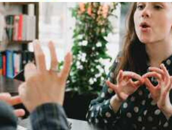
Luisteren naar doven