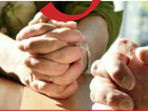
Bidden in een restaurant