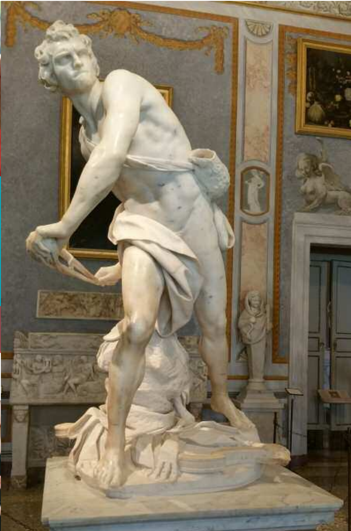
Inspiratie uit de strategie van David