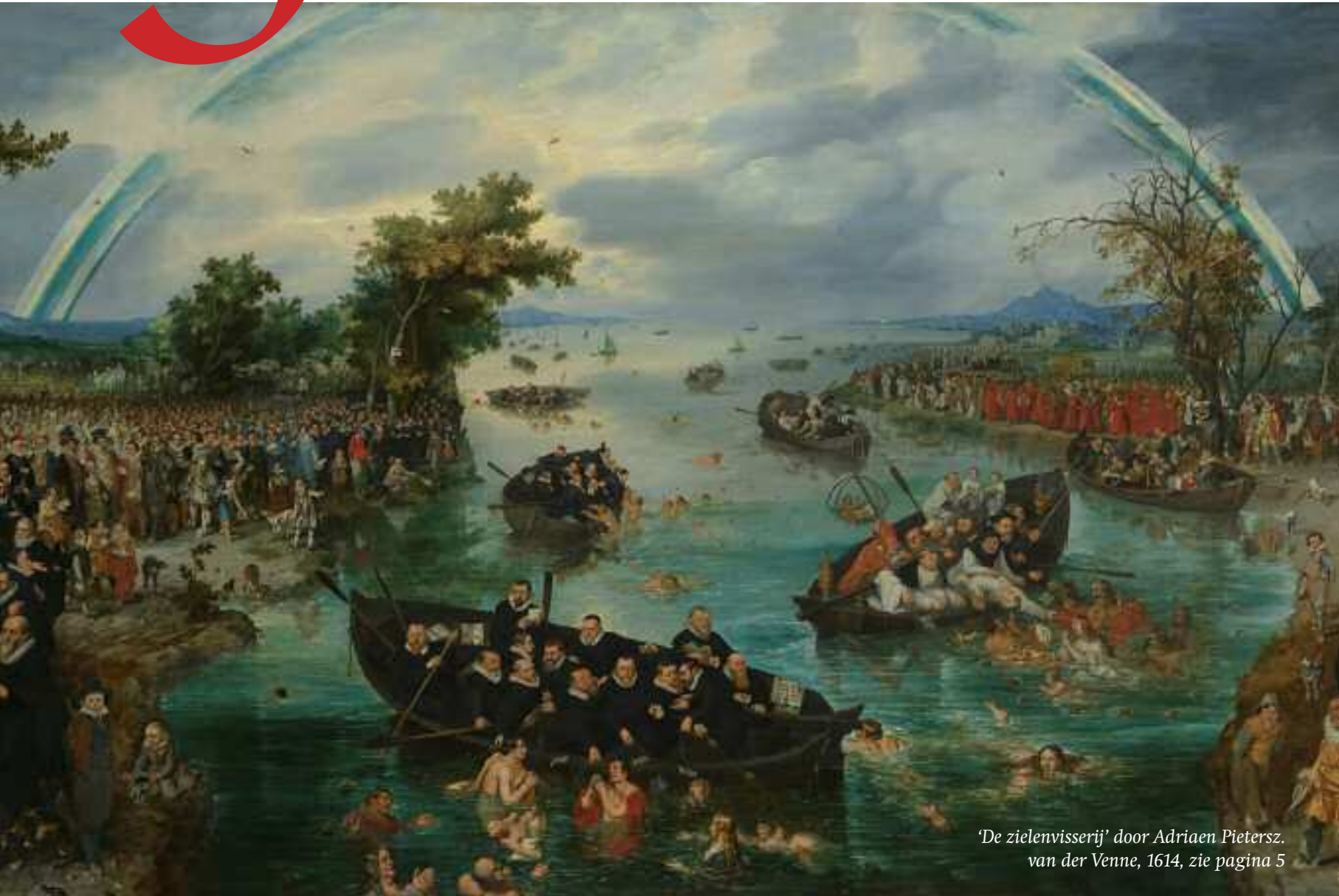
'De zielenvisserij' door Adriaen Pietersz. van der Venne, 1614, zie pagina 5