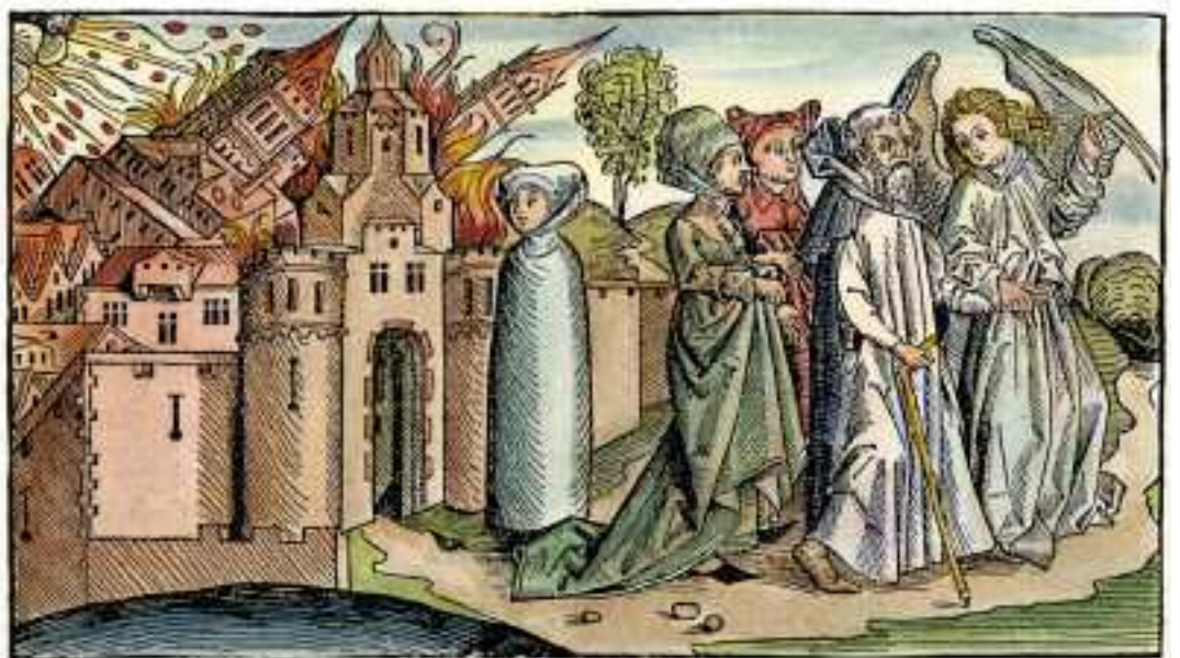
De vlucht van Lot en zijn dochters uit Sodom, verbeeld in het Liber Chronicarum, een geïllustreerde encyclopedie uit Neurenberg uit 1493. Lots vrouw keek om en werd een zoutpilaar.

uit: Gedichten, uitgeverij Van Oorscot, Amsterdam 2023