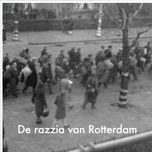
De razzia van Rotterdam