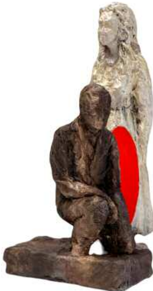
Het monument van keramiek bestaat uit een knielende man en een staande vrouw, van elkaar gescheiden door een vlam. Het drukt de scheiding uit tussen een geëmotioneerde vrouw en een man in wanhoop. Maar niet voor altijd: de vlam toont aan dat de hoop nooit verloren gaat.

Er liep tussen de gearresteerden ook een oudere Jood die nog een Davidster opgespeld