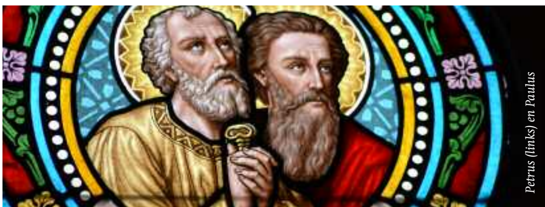
Petrus (links) en Paulus