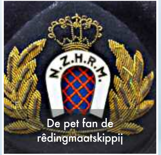
De pet fan de rêdingmaatskippij

Ons leven hangt niet aan een zijden draadje, maar aan de rode draad van Gods liefde in Jezus Christus