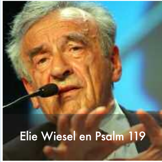
Elie Wiesel en Psalm 119