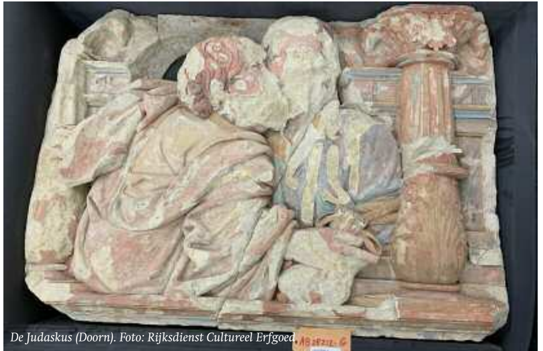
De Judaskus (Doorn).