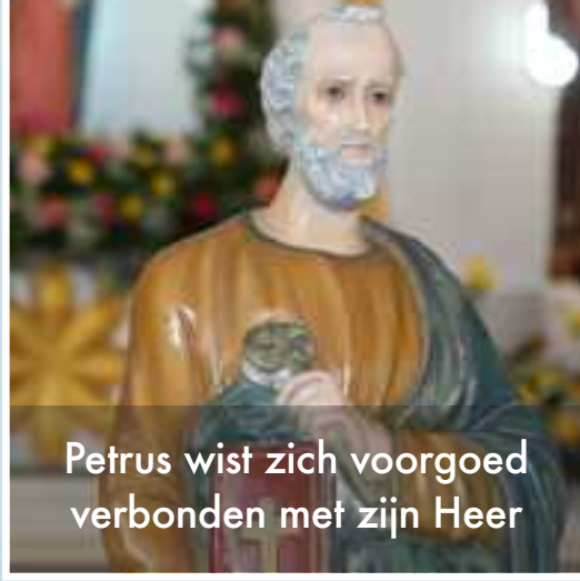
Petrus wist zich voorgoed verbonden met zijn Heer