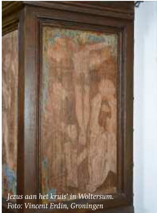
Jezus aan het kruis' in Woltersum.