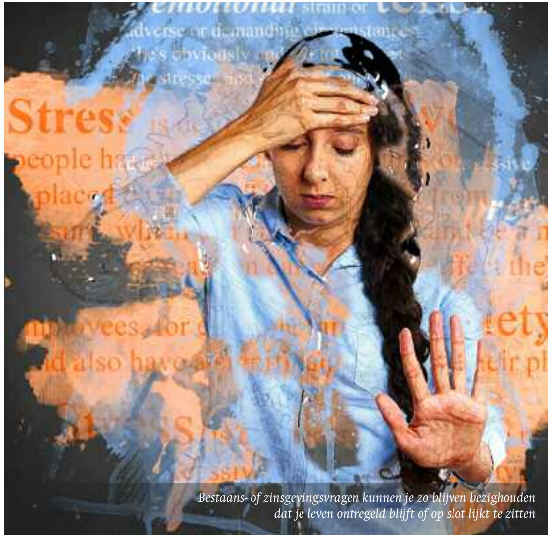
Bestaans- of zingevingsvragen kunnen je zo blijven bezighouden dat je leven ontregeld blijft of op slot lijkt te zitten

In geestelijke zorg kan geloof een rol spelen, maar dat hoeft niet. Wanneer iemand gelovig is kan het zijn dat geloof een belangrijke rol